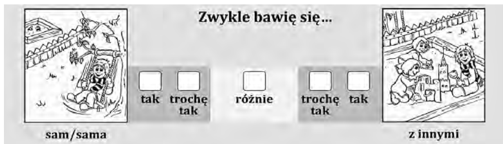
Rysunek 1. Przykładowy item ze skali ekstrawersji