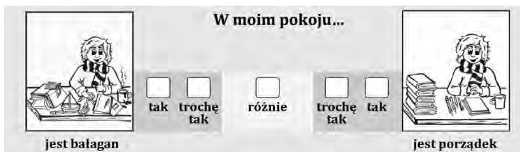
Rysunek 3. Przykładowy item ze skali sumienności

ku 1 lewy obrazek jest wskaźnikiem introwersji, a prawy ekstrawersji; na rysunku 2 – lewy obrazek jest wskaźnikiem niskiej otwartości, a prawy wysokiej. Wszystkie ilustracje zawierają sytuacje z codziennego życia dziecka.