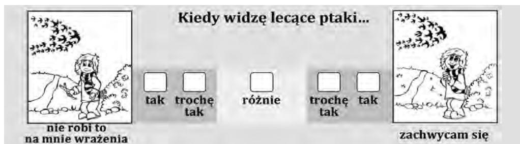
Rysunek 2. Przykładowy item ze skali otwartości na doświadczenie