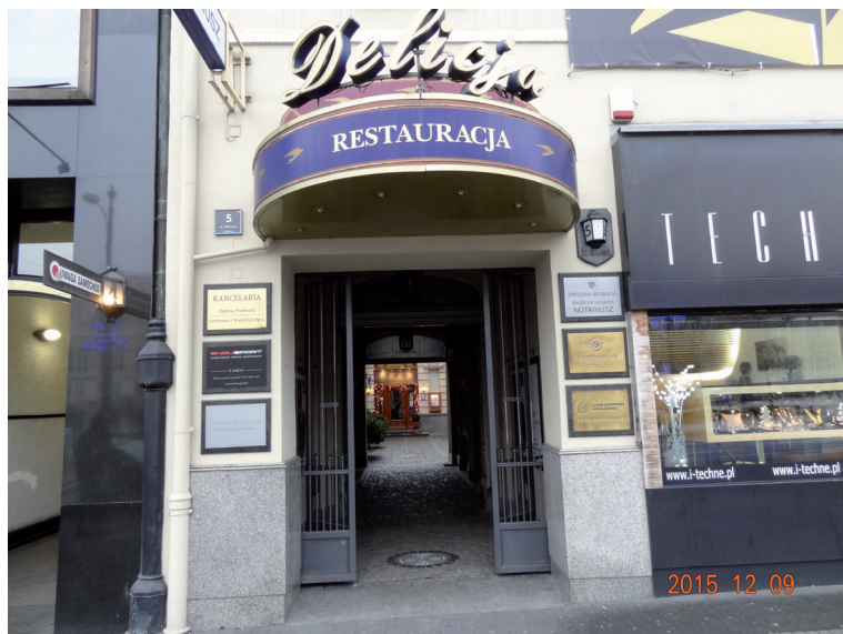
Widok na bramę wejściową do budynku przy pl. Wolności 5 w Poznaniu, gdzie mieścił się Klub Demokratycznej Profesury