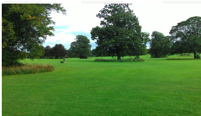
Ill. 1. Prospect Park in Reading (photo by M. Lubiartz, 2013)