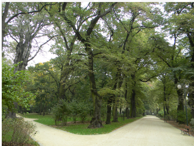
Ill. 2. Saxon Garden in Lublin