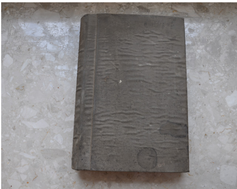
II. 4. Oprawa księgi inwentarzowej