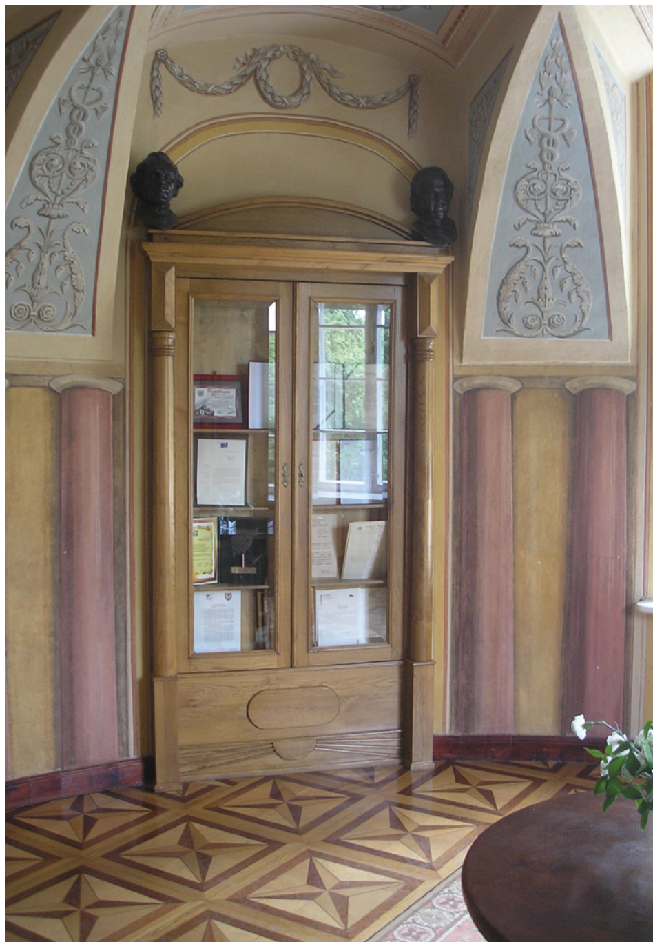
II. 2. Fragment wnętrza dawnej biblioteki pałacowej w Lubostroniu