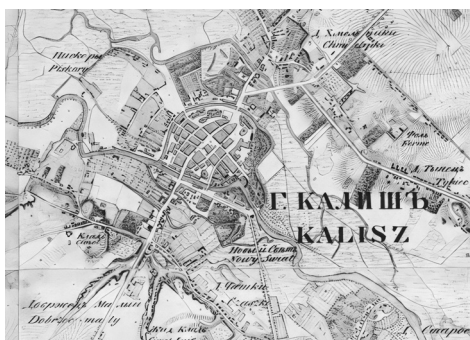
Fot. 1. Plan okrestnostenj goroda Kališa. Instrumental'no snătij pod rukovodstvom General'nago Staba Stabs Kapitana Bergenstrolâ no maasštahu 1/21000 (w Anglinskom dŭjme 250 Cažen) / Plan des Environs de Kalisz lèvi sous les ordres du Capitaine en second de l'Etat Majer Bergenstrolé, 1:21000, 250 sążni na stopę angielską, 1835.