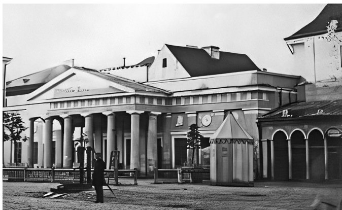
Fot. 3. Widok Głównego Rynku w Kaliszu od strony północnej w kierunku południowym, widoczny pawilon odwachu oraz arkadowe sklepy miejskie w bloku zabudowy śródrzynekowej.