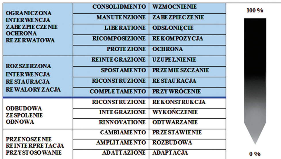
II. 1. Wpływ autentyczności dziedzictwa kultury na stopień interwencji