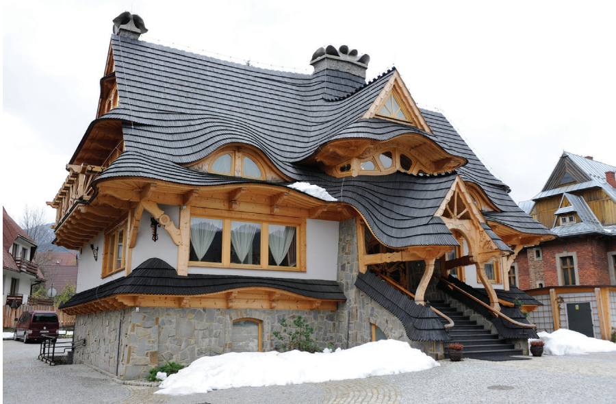
Il. 34. Willa „Kominiarski Wierch” przy ul. Kościeliskiej (2008–2009, proj. S. Pitoń).