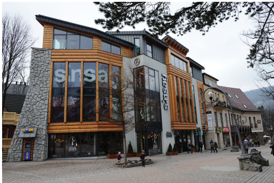
Il. 40. Budynek usługowy z cukiernią „Samanta” przy ul. Krupówki (2015–2016, proj. Jacek Burdziński). Fot. Zbigniew Moździerz, 2017. Zbiory prywatne