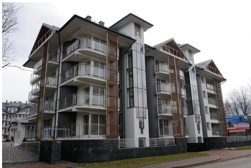
Il. 37. Apartamentowce „Stara Polana” przy ul. Nowotarskiej (2007–2008, proj. S. Topór). Fot. Dawid Możdziej, 2009. Zbiory prywatne