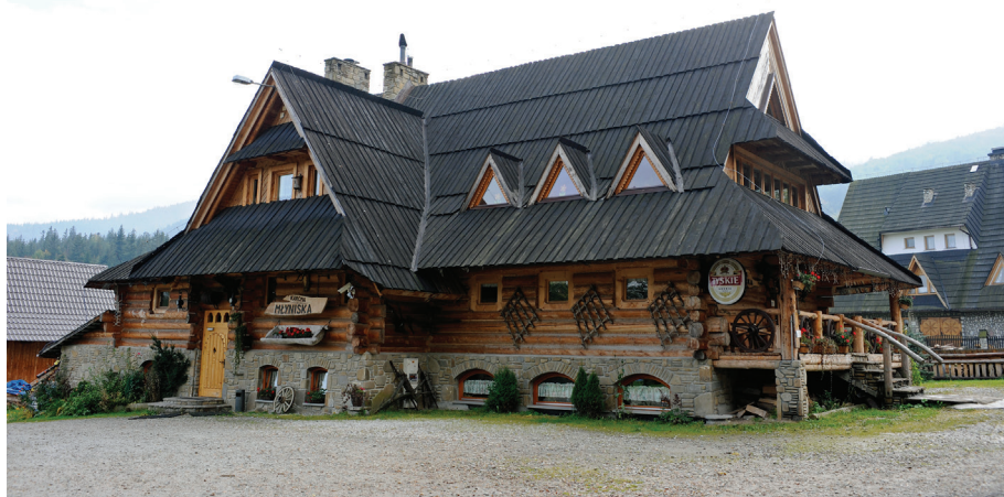
Il. 32. Karczma „Młyniska” przy Drodze do Daniela (2000, proj. J. Karpieł „Bułeczka” sen.).