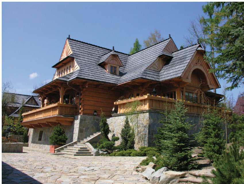
Il. 36. Budynek rekreacyjny przy „Witkiewiczówce” na Antałówce (2013, proj. K. Kiełb, współpraca J. Kowalczyk).