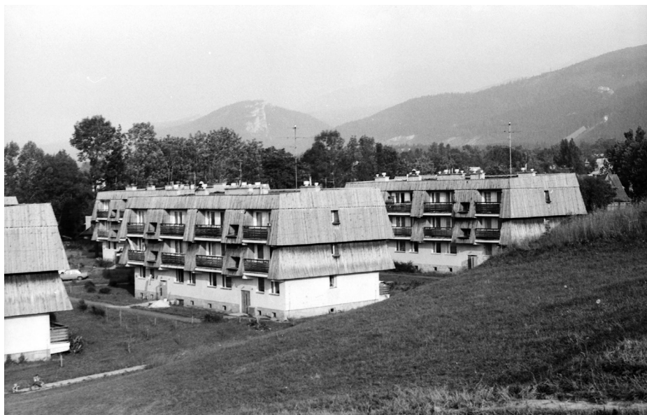
Il. 29. Osiedle Lipki przy ul. Kasprusie (1974–1978, proj. arch. J. Dajewski, Z. Remi, S. Tylka, proj. urb. Z. Szpakowska). Fot. Zbigniew Możdzierz, 1985. Zbiory prywatne