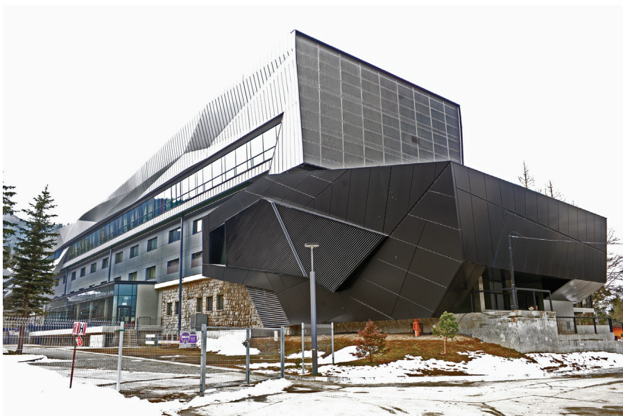
Il. 39. Centralny Ośrodek Sportowy – Ośrodek Przygotowań Olimpijskich Zakopane (2010–2012, proj. S. Karpień, T.T. Stopa, P. Walorek). Fot. Dawid Moździerz, 2013. Zbiory prywatne