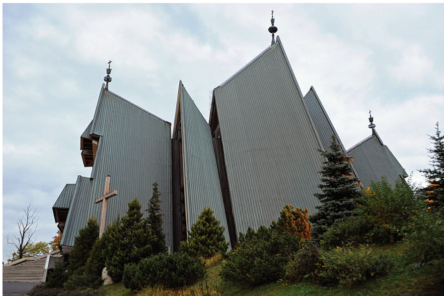
Il. 30. Kościół pw. Matki Boskiej Objawiającej Cudowny Medalik na Olczy (1981–1988, proj. T. Gawłowski, T. Lisowska-Gawłowska). Fot. Dawid Moździerz, 2008. Zbiory prywatne