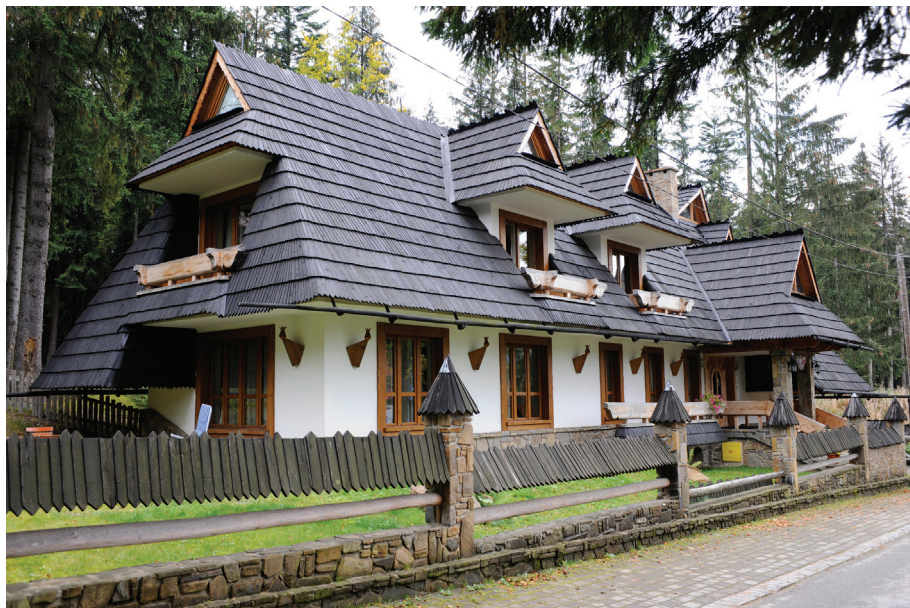
Il. 33. Pensjonat „Dworek Bawarski” przy ul. Bogdańskiego (proj. K. Gądek).