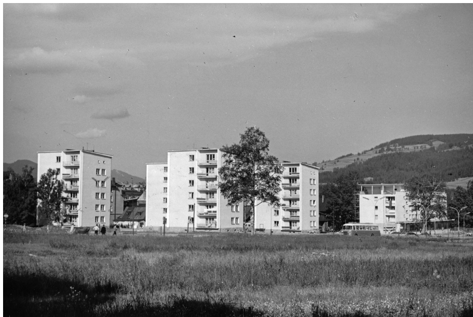
Il. 28. Osiedle mieszkaniowe przy al. 1 Maja, obecnie al. 3 Maja (1963–1965, proj. J. Dajewski). Fot. Władysław Werner, 1965. MT-ZA, sygn. AF/07493/MT/III-015