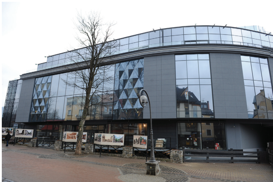
Il. 41. Centrum Handlowe „Krupówki” przy ul. Krupówki (2012–2017, proj. A. i R. Rafaczowie).