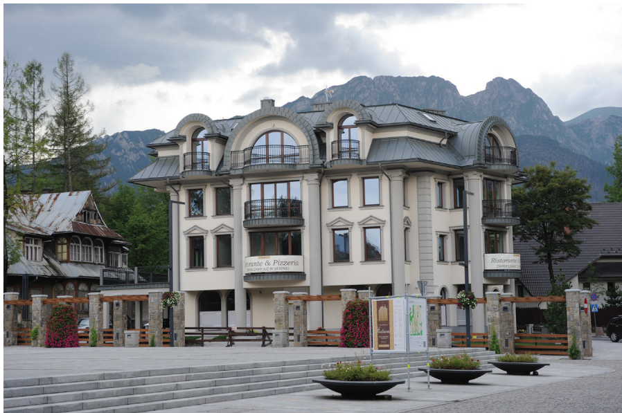
Il. 38. Budynek mieszkalno-usługowy „Polonia” przy placu Niepodległości (2012–2014, proj. S. Topór). Fot. Dawid Moździerz, 2014. Zbiory prywatne