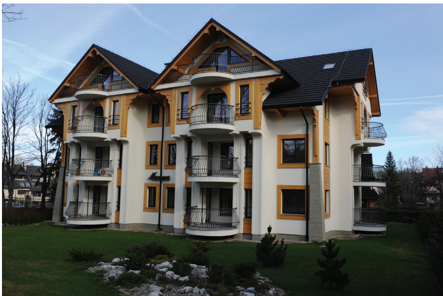
Il. 35. Pensjonat „Manru” przy ul. Grunwaldzkiej (2011–2012, proj. S. Topór). Fot. Dawid Moździerz, 2012. Zbiory prywatne