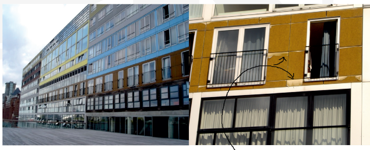
Ill. 5, 6. Office and residential building Silodam, Amsterdam (arch.MVRDV), 2002