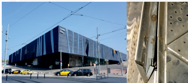
Ill. 21, 22. Museum of Natural History Museu Blau (arch. Herzog&de Meuron), 2012