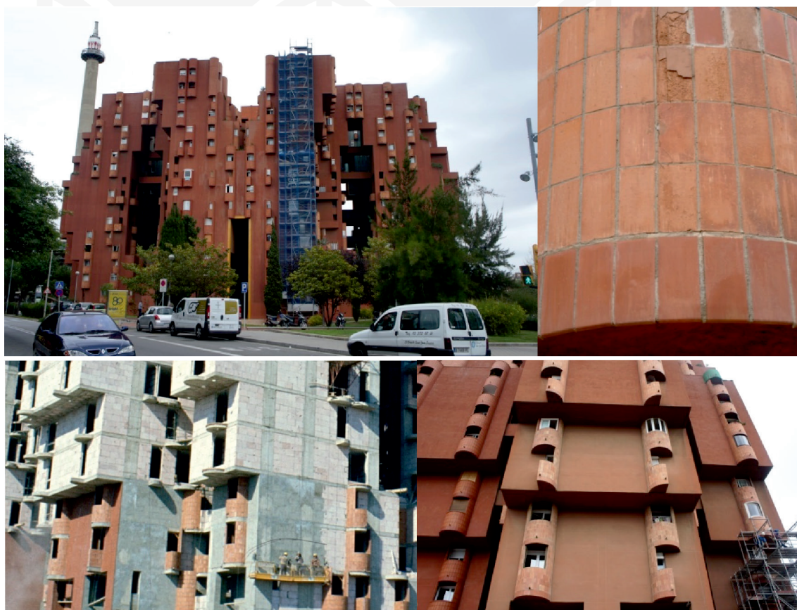
III. 25, 26, 27, 28. Residential building Walden 7 (arch. R. Bofill), 1975