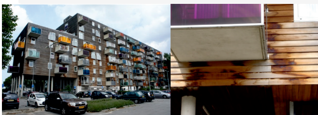
III. 9, 10. Seniors house WoZoCo, Amsterdam (arch. MVRDV), 1997