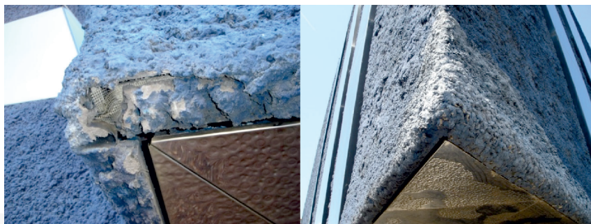
III. 23, 24. Museum of Natural History Museu Blau (arch. Herzog&de Meuron), 2012