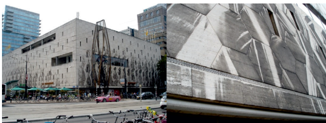
III. 7, 8. Shopping center De Bijenkorf, Rotterdam (arch. M. Breuer), 1957