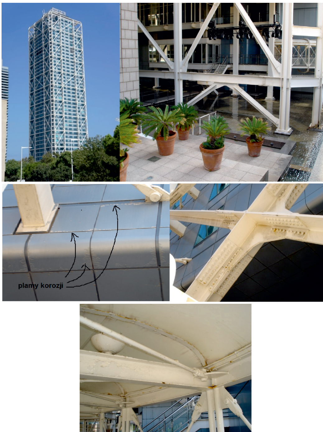
III. 12, 13, 14, 15, 16. Hotel Arts, Barcelona (arch. SOM), 1992