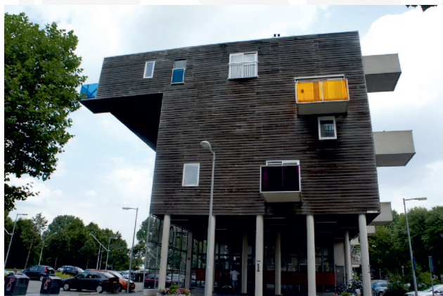
III. 11. Seniors house WoZoCo, Amsterdam (arch. MVRDV), 1997