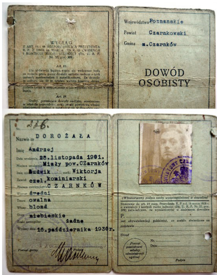
Il. 2. Jednolity dowód tożsamości – dowód osobisty wzór 28.