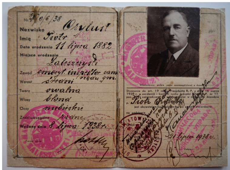
Il. 4. Dowód osobisty z Zaleszczyk stempłowany ukraińskimi pieczętkami miejskimi.

pierwszej stronie okrągłą pieczęcią wojennego komendanta oraz również nieczytelnym wpisem.