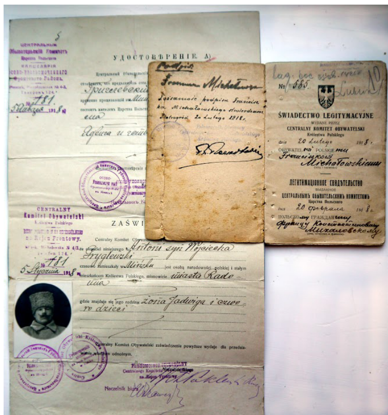
Il. 1. Paszport mieszkańca Królestwa Polskiego oraz świadectwo legitymacyjne wydane przez Centralny Komitet Obywatelski Królestwa Polskiego.

W 1919 r. pojawiły się szesnastostronicowe książeczki w kartonowej okładce, zawierające prócz zdjęcia: dane osobowe, informacje o zawodzie, wyznawanej religii, obywatelstwie, umiejętności czytania i pisania oraz ryśpis. Wbrew nazwie, były właściwie paszportami. Odnotowywano w nich miejsca tymczasowego zameldowania podczas podróży. Były dość drogie i służyły niemal wyłącznie bogatszym obywatelom. Dokument był niewygodny i niemal niezabezpieczony przed fałszerstwem.