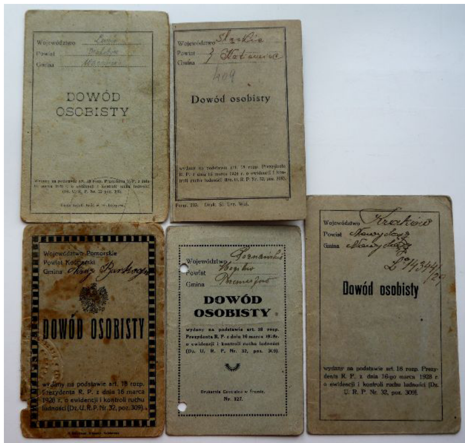
Il. 3. Wzory Dowodów osobistych wydanych w różnych rejonach kraju.