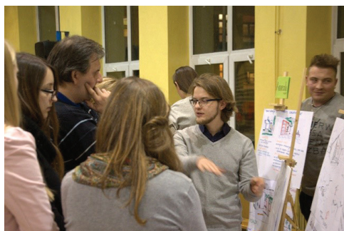
II. 4. Konsultacje projektów z mieszkańcami, 2016

III. 3. Consultation with residents, 2016