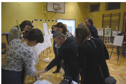
II. 3. Konsultacje projektów z mieszkańcami, 2016

III. 2. Design workshops „Budka na książki”, 2016