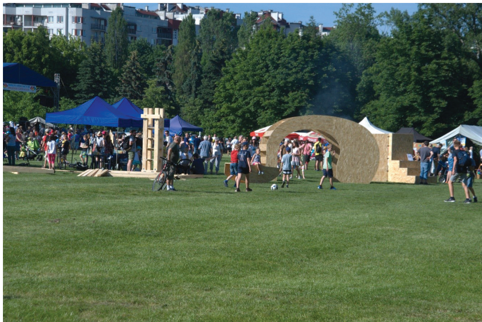
II. 7. Dni Dzielnicy III, 2017