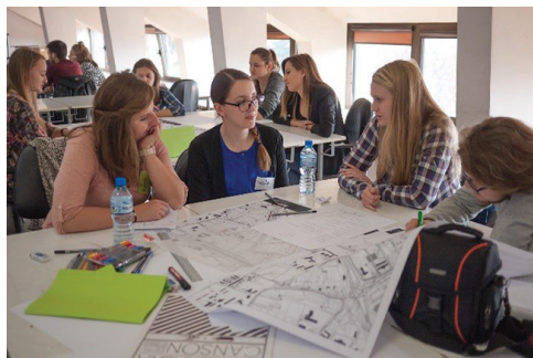
II. 2. Warsztaty projektowe „Budka na książki”, 2016

III. 1. Workshops „Future City Game”, 2013