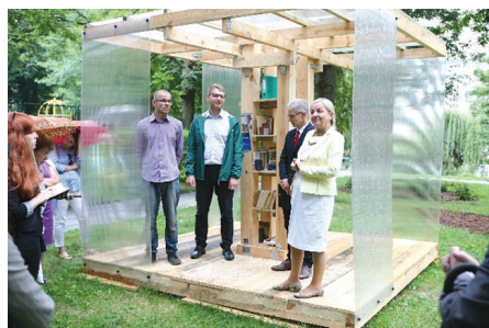
II. 9. Finał plebiscytu, 2017 (Wydział Rewitalizacji UMK)

III. 8. Mounting prototypes Ugorek, 2017