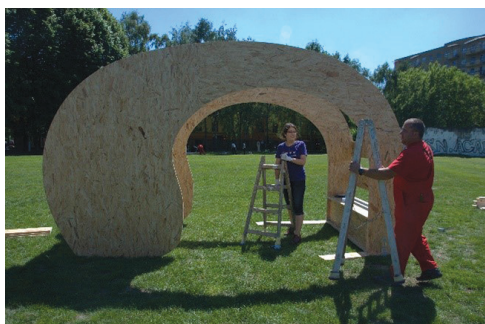
II. 5. Dni Dzielnicy III, 2017

III. 4. Consultation with residents, 2016