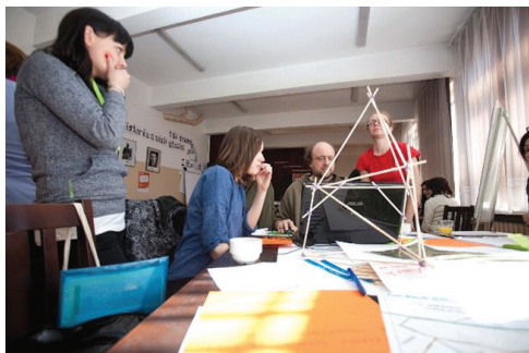
II. 1. Warsztaty „Future City Game”, 2013 (Wydział Rewitalizacji UMK)

III. 1. Workshops „Future City Game”, 2013