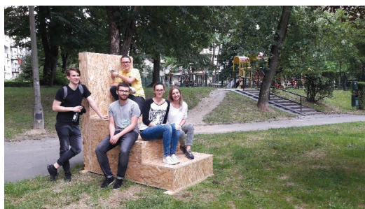
II. 8. Montaż prototypów Ugorek, 2017

III. 8. Mounting prototypes Ugorek, 2017