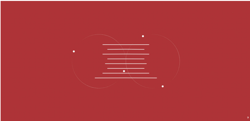
Ilustracja 2. A. Chen, Baroque.me (Bach) .