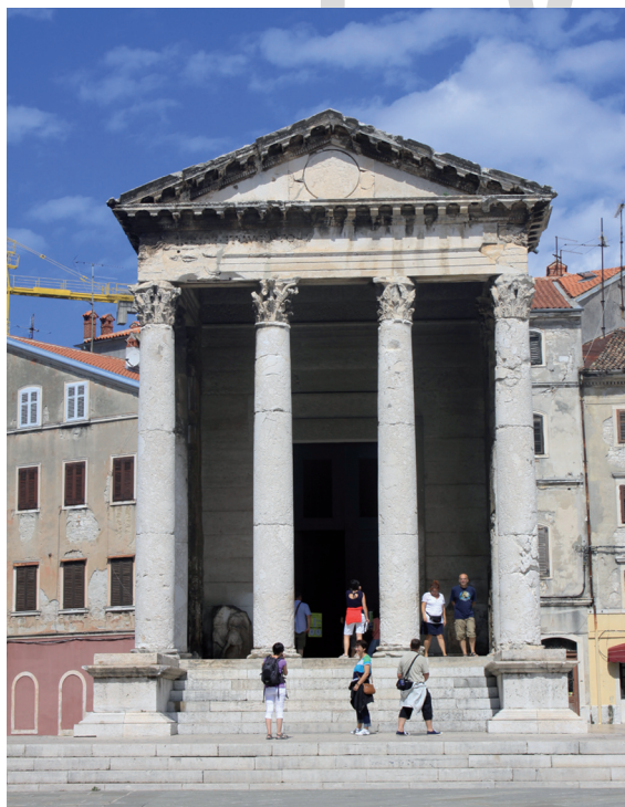
III. 4. Façade of the Temple of Augustus in Pula