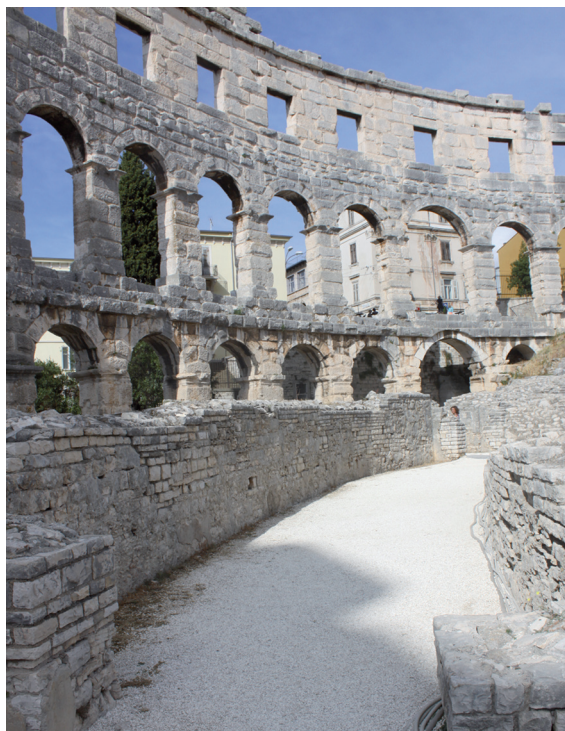
III. 3. Amphitheatre wall in Pula