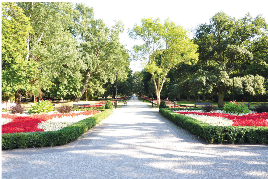
III. 1. Health Resort Park, Bolesława Chrobrego (photo by M. Rzeszotarska-Pałka, 2015)