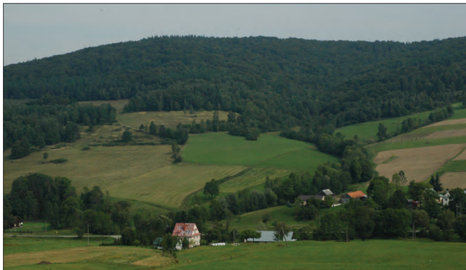
Fot. 1. Owczary. Wkraczanie roślinności leśnej wzdłuż rozcięć erozyjnych Photo 1. Expansion of forest along erosional forms at Owczary