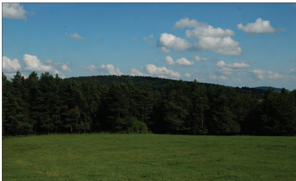
Fot. 2. Wyszowatka. Granica statyczna Photo 2. The static forest-field boundary at Wyszowatka