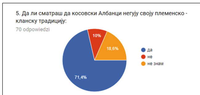
Diagram 1. Opinia na temat kultywowania tradycji klanowo-plemiennych przez kosowskich Albańczyków. Badania własne przeprowadzone w Serbii i Czarnogórze w latach 2014–2017.

(Legenda w j. polskim: kolor niebieski – tak, kolor czerwony – nie, kolor żółty – nie wiem).