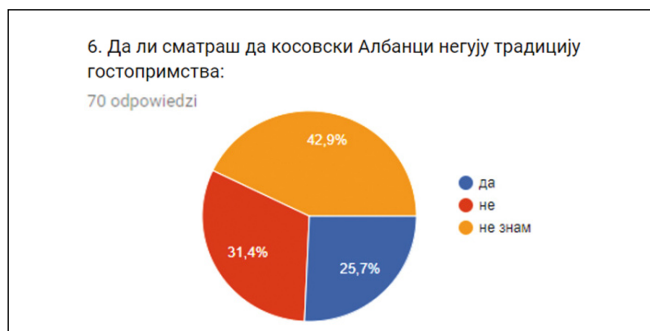
Diagram 2. Opinia na temat kultywowania tradycji gościnności przez kosowskich Albańczyków. Badania własne przeprowadzone w Serbii i Czarnogórze w latach 2014–2017.

(Legenda w j. polskim: kolor niebieski – tak, kolor czerwony – nie, kolor żółty – nie wiem).