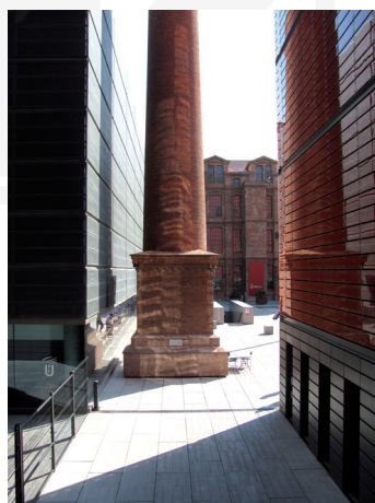
III. 12–16. Barcelona – Poblenou – contemporary revitalization redevelopment