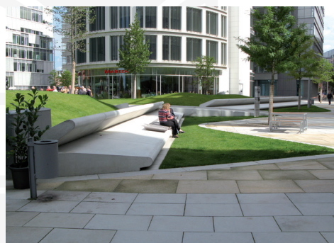
III. 7–9. Hamburg – Hafencity