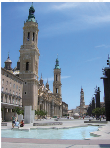
III. 1–2. Saragossa – Plaza de Nuestra Señora del Pilar – contemporary creative interpretation of the climate of the place – arrangement of a historic piazza