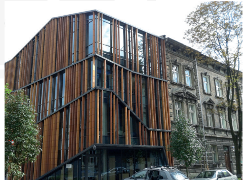
III. 4–5. Cracow, Poland: Garden Art, Rajska Street – a contemporary intervention in the historical tissue; INGARDEN & EWY ARCHITEKCI, 2005–2012 (photo by the author, 2009)