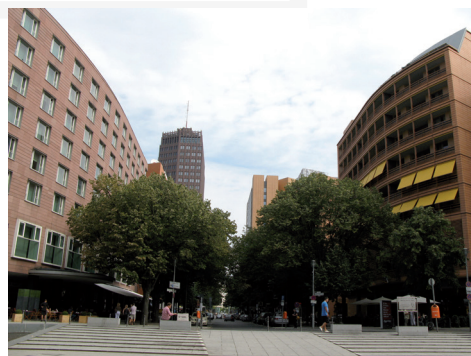
III. 10–11. Berlin – Potsdamer Platz