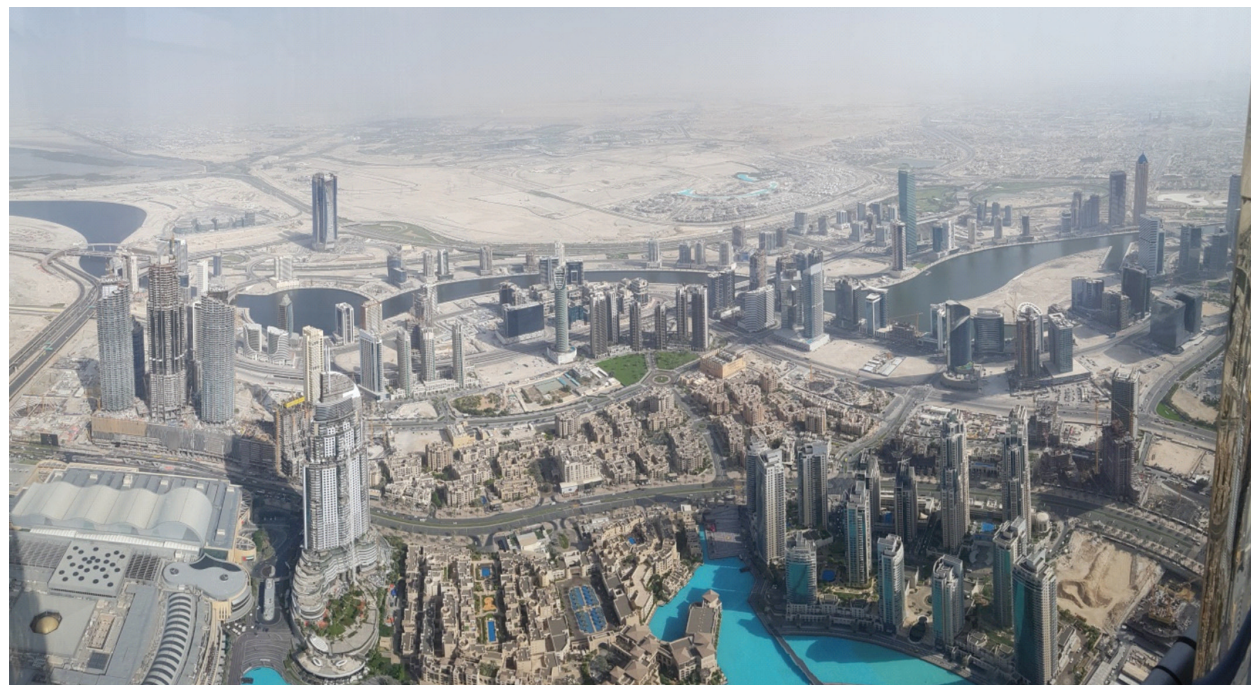
II. 3. Widok Dubaju z tarasu At The Top Sky (piętro 148). Dubai viewed from the upmost terrace (At the Top Sky, storey 148).