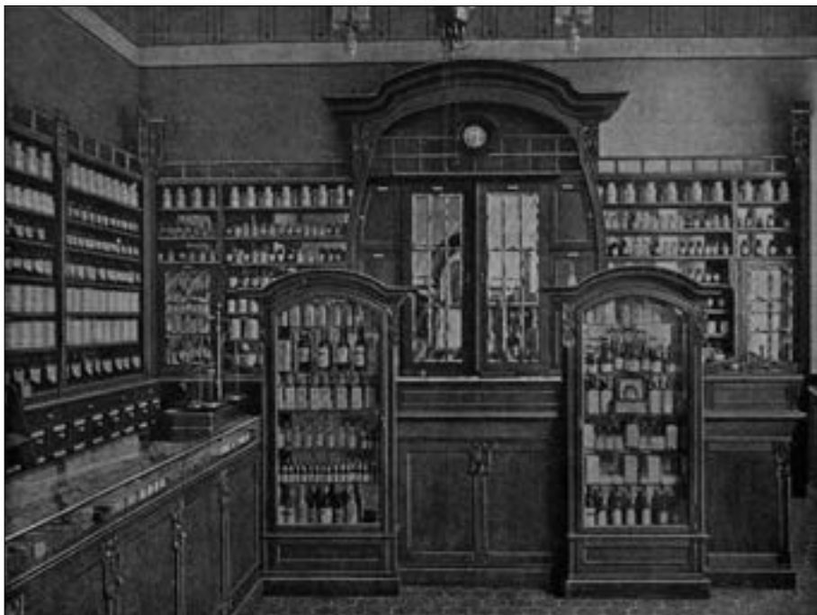
Il. 1. Jedna z propozycji secesyjnego wyposażenia apteki pochodząca z katalogu firmy Hermann Steinbuch (1911).