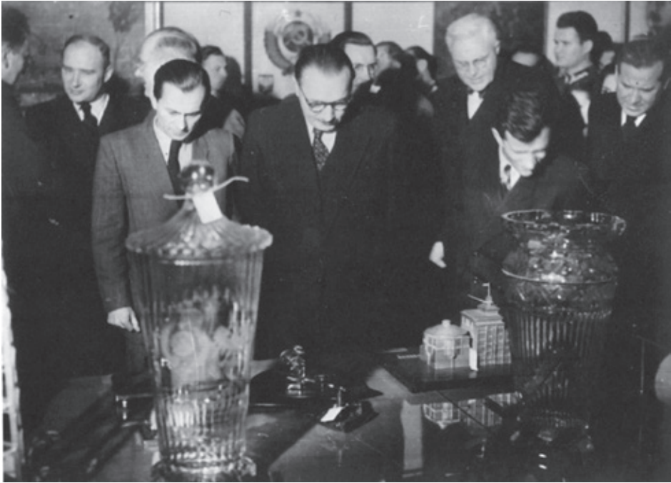
Il. 2. Boełsław Bierut z członkami Biura Politycznego na wystawie z okazji 70. rocznicy urodzin Józefa Stalina, ok. 1948 r.