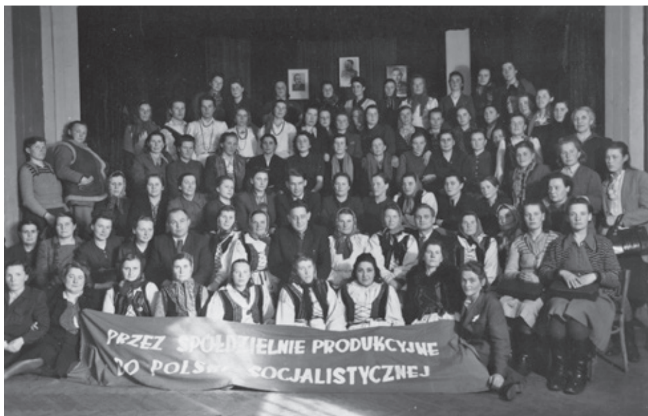
Il. 3. Grupowe zdjęcie delegatek spółdzielni srodukcyjnych podczas wizyty w KW PZPR w Lublinie z okazji Święta Kobiet, 1950 r.

Duża ilość zdjęć przedstawia działaczy partyjnych, państwowych i społecznych, weteranów rewolucji październikowej, wojny domowej w Rosji i wojny domowej w Hiszpanii, a także kombatantów Gwardii i Armii Ludowej. Zbiór, który ilustruje wojewódzkie konferencje partyjne i plena oraz V i X Zjazd Polskiej Zjednoczonej Partii Robotniczej jest najbogatszym zbiorem przejętym po AKW PZPR w Gdańsku. W zbiorze odnaleźć również można fotografie takich osobistości jak Charles de Gaulle i Fidel Castro oraz zdjęcia dokumentujące zniszczenia, jakie przyniosła wojna oraz te z odbudowy Gdańska. W gdańskim AKW zgromadzono także fotografie ze strajku robotników Wybrzeża w sierpniu 1980 r. Są to fotografie z dużą dozą emocji i znacznie odbiegające od socrealistycznego kanonu, przedstawiające zmęczonych i modlących się robotników. Ustrój gospodarczy to w głównej mierze obrazy z placów budowy, państwowych gospodarstw rolnych i zakładów przemysłowych. Fotografie gdańskiego KW PZPR „(...) pogłębiają obraz badanej rzeczywistości, pozwalają jej przybrać realne kształty, wydobywając to, co nie jest zawarte w słowie pisanym” 39 .