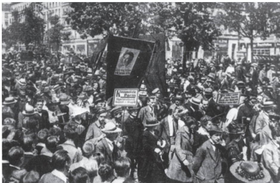
Il. 1. Demonstracja w Berlinie po śmierci Róży Luksemburg, 1919 r.