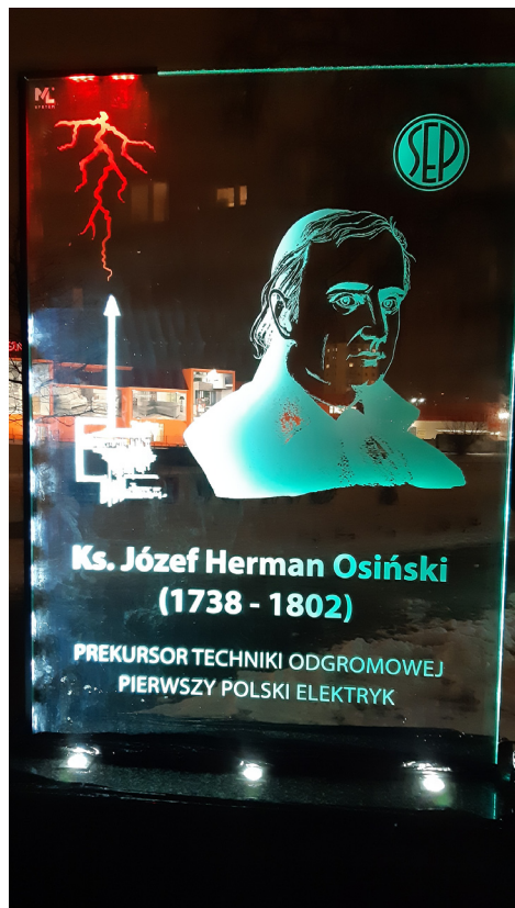
Ryc. 5. Pomnik ks. Józefa Hermana Osińskiego z nową podobizną nocą.