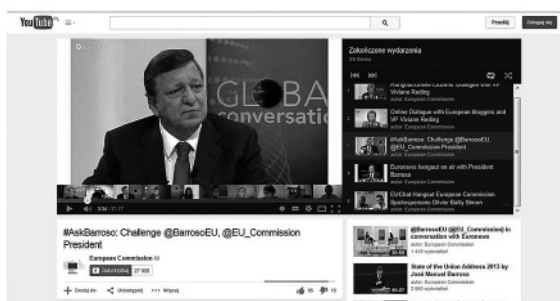
Ilustracja 2. Strona EuTube – oficjalnego kanału Unii Europejskiej w serwisie YouTube