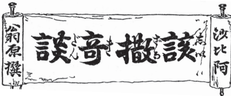
Ryc. 3. Tytuł z karty tytułowej Shizaru kidan (por. ryc. 1).

na rosnącą świadomość potrzeby wytworzenia nowego paradygmatu dramatycznego w Japonii. To właśnie poprzez krytykę propozycji rządowych literaci ery Meiji zaczęli rościć sobie prawo do poważniejszych wysiłków w kierunku adaptowania zachodnich dramatów i sposobów reprezentacji.