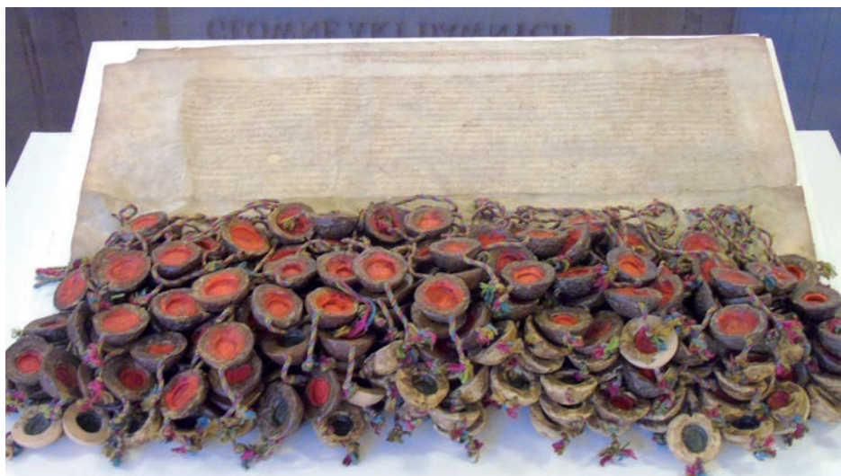
Konfederacja Generalna Warszawska z 28 stycznia 1573