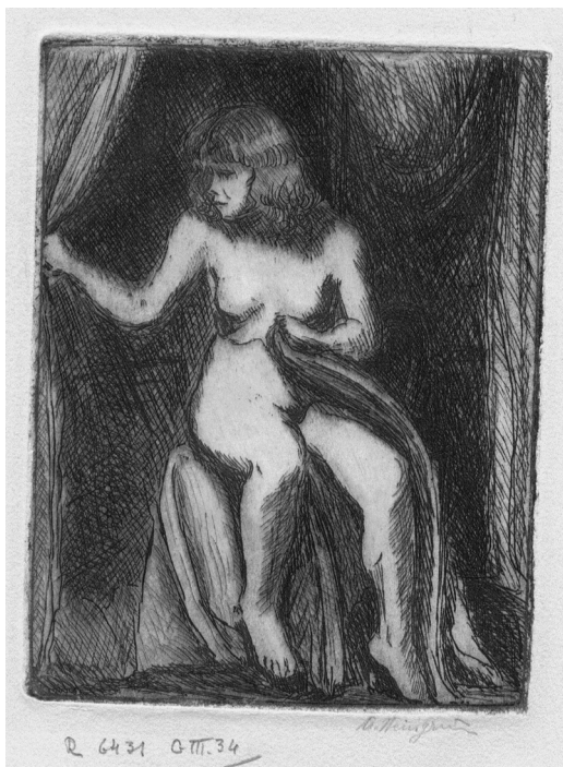
Il. 4. Anna Weingrün-Lieblich, Studium aktu kobiety siedzącej , akwaforta, Biblioteka Akademii Sztuk Pięknych w Krakowie, sygn. 6431.

dziewczyny w siedzącej pozie, uchylającej łagodnym gestem zasłonę (il. 4). Praca zwraca uwagę pełnym ciepła skupieniem rytowniczką na kruchości i delikatności dziewczyny. To nie tyle typowe dla szkoły artystycznej studium proporcji ludzkiego ciała, co raczej intymna scena we wnętrzu, gdzie naturalność i zaznaczony rys indywidualny przedstawionej postaci grają pierwszoplanową rolę. Ciepło oraz delikatna nuta humoru są też wyczuwalne w innych pracach artystki, zwłaszcza przedstawieniach sylwetek ludzkich charakteryzowanych z wyczuwalną sympatią, często za pomocą jedynie kilku nieskomplikowanych kresek.