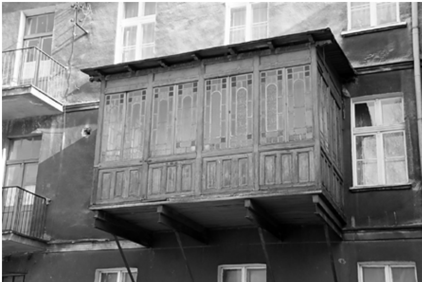
4. Sukka przy ulicy Chopina 17.

Pozostałe do dziś w Kaliszu kuczki, to m.in. ta przy Chopina 17. Jej forma, z misterną robotą snycerską i witrażami, wskazuje na to, że jej fundatorzy należeli do osób zamożnych. W podobnym guście jest kuczka przy Pułaskiego 4; osadzona na murowanym sklepieniu, wykonana z drewna, przeszklona i zaopatrzona w dekoracyjną żeliwną kratownicę. Ostatni z trzech zachowanych szalasów – przy Mazurskiej 1, bardzo prosty w swojej formie, wygląda na najstarszy w Kaliszu. Dobrze zachowana sukka znajduje się również