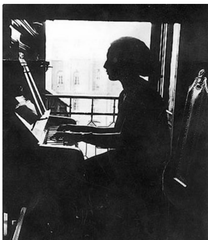
1. Wewnątrz żeńskiej kuczki. Kalisz, lata 20, bądź 30 XX wieku.

Na święto Sukkot używa się lulawu. Jest to kompozycja czterech rodzajów roślin; jednej gałązki palmowej, dwóch wierzbowych, oraz trzech gałęzi mirtu. By celebrować Święto Szalasów, niezbędny jest także specjalny cytrus – etrog, rosnący naturalnie w Izraelu 72 .