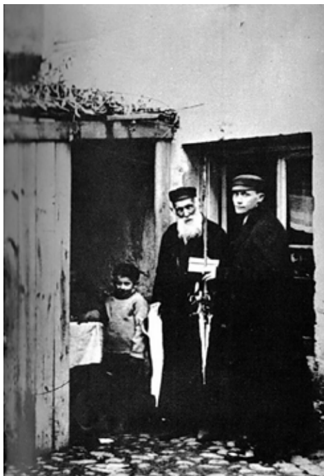
2. Rodzina żydowska w Kaliszu przed wejściem do szałas (kuczki). Lokalizacja nieznana.