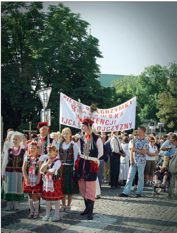
Fot. 2. Piesza Pielgrzymka Krakowska