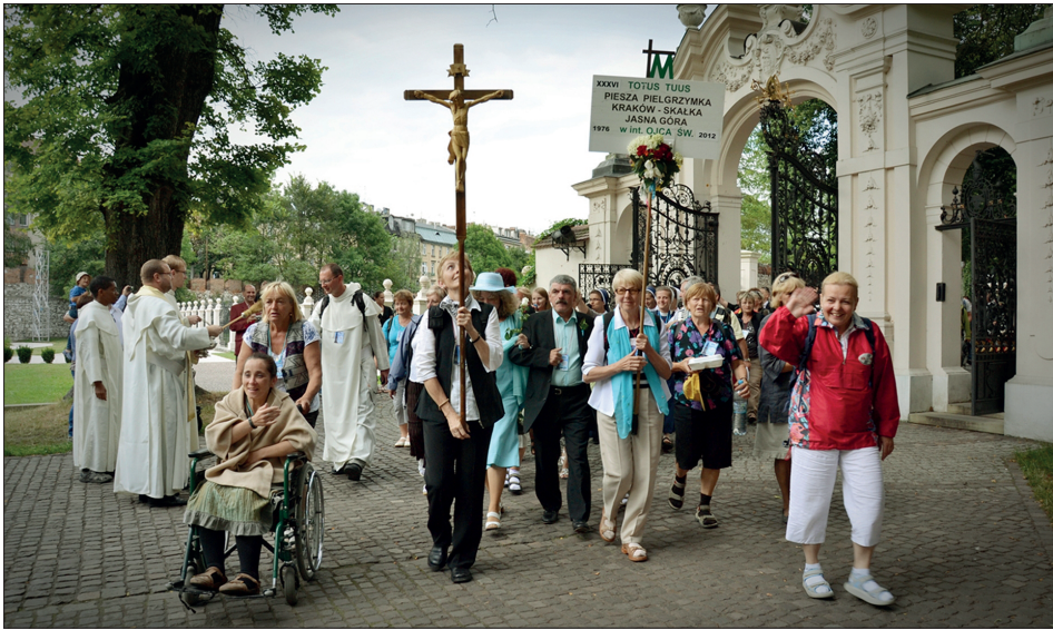
Fot. 1. Tablica pielgrzymkowa 36. Pieszej Pielgrzymki Skalecznej