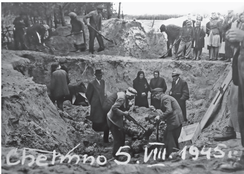
Il. 2. Ekshumacja zakładników polskich, na fot. błędna data.