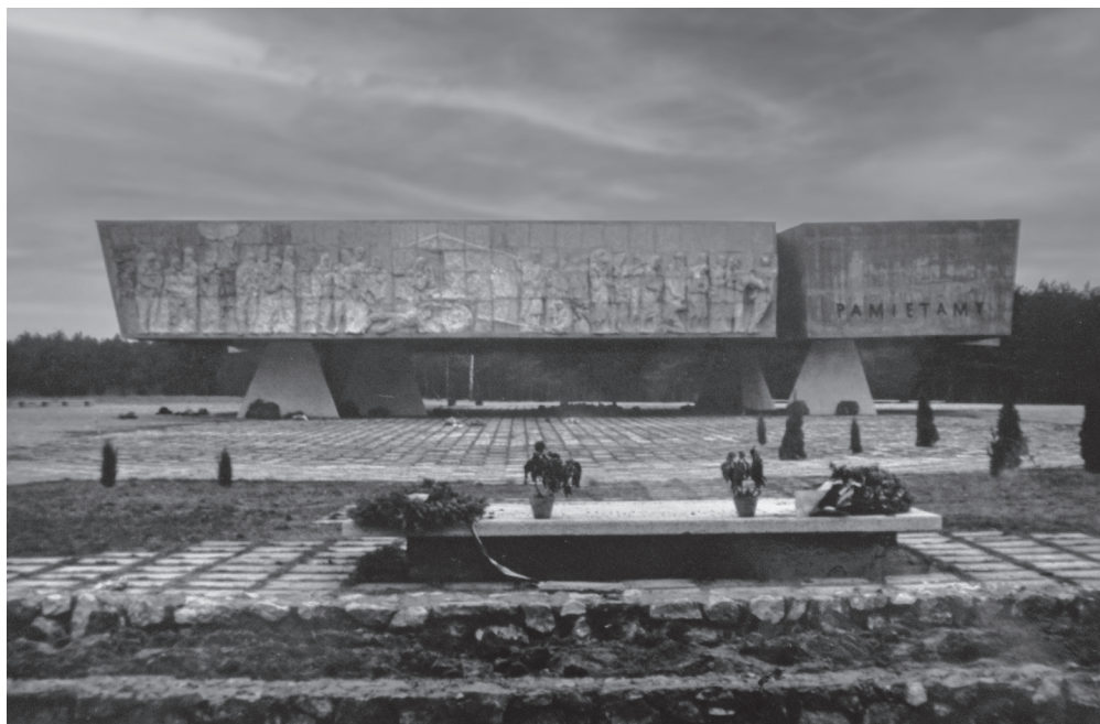
Il. 7. Pierwsza płyta nagrobna, w tle widoczny Pomnik Ofiar Faszyzmu, fot., l. 70.