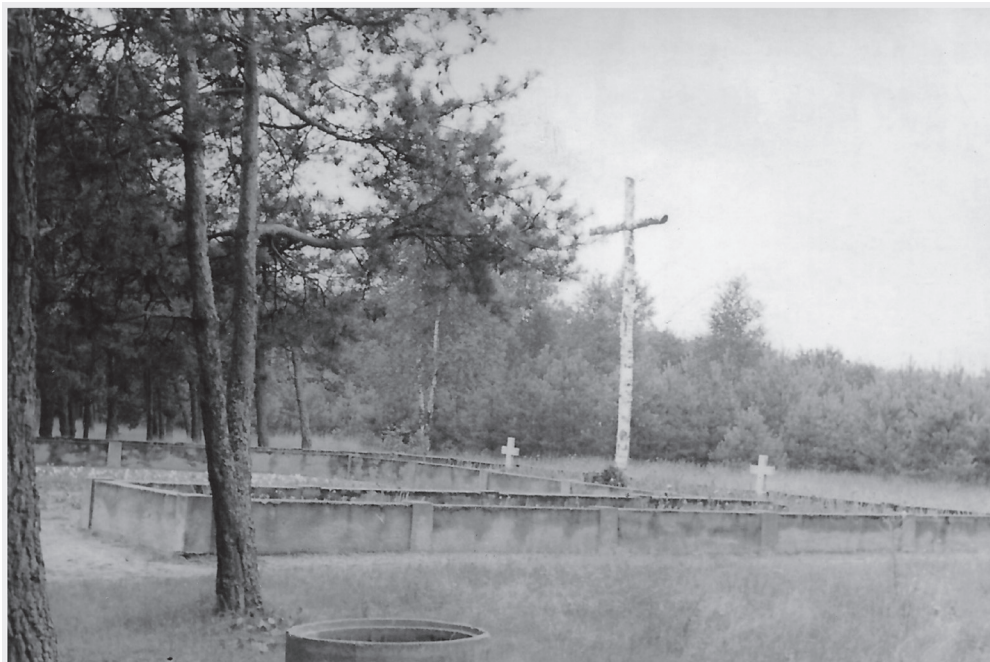
Il. 5. Mogiła obmurowana wysokimi krawężnikami, fot. 30 lipca 1961.

Wzniosła idea opisywanego pomnika szybko upadła. „Prosimy o skromny znak pamięci: krzyż duży, uporządkowanie grobu, zasadzenie drzew i zimotrwałych kwiatów. [...] Fundament pod krzyż jest wykonany” – czytamy w piśmie 33 . Krzyże określonego wzoru wznoszono w wielu miejscach hitlerowskich zbrodni jako pomniki tymczasowe 34 . Zebrany materiał ikonograficzny potwierdza obecność dużego brzoźowego krzyża (z czasu pogrzebu) oraz dwóch mniejszych w układzie antytetycznym (il. 5).