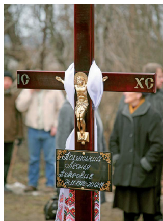
Krzyż na grobie Leona Polańskiego