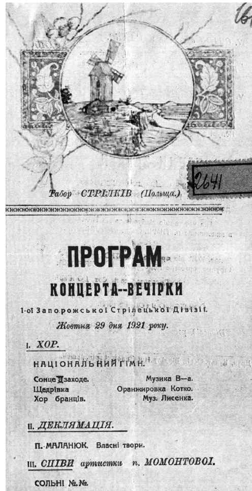
Fot. 4 Program koncertu w Strzałkowie.

Źródło: Z osobistego archiwum Viktora Moreneta. Po raz pierwszy opublikowany [w:] Armia za kratkami. Zbiór dokumentów / edytor-kompilator V. Morenets, Kamieniec-Podolski, 2018, s. 349.