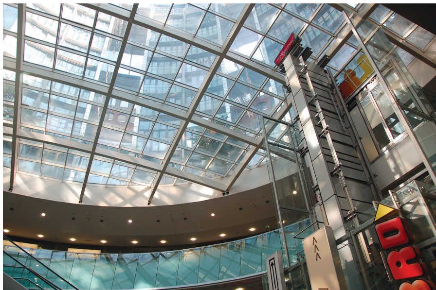
II. 5. Wiedeń, Gazometr A, wewnątrz Centrum Handlowego