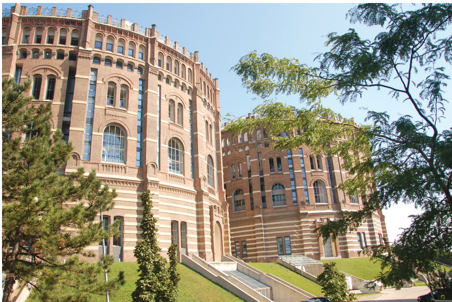
II. 1. Wiedeń, Gazometry C i D