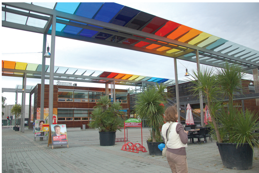
II. 8. Linz, SolarCity, LunaPlatz