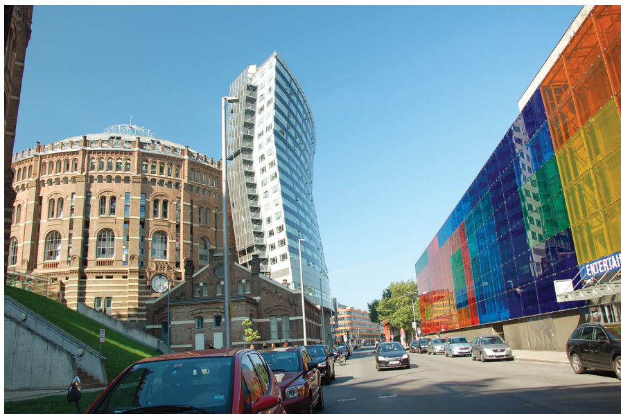
II. 6. Wiedeń, Gazometr B oraz przestrzeń ulicy Guglgasse