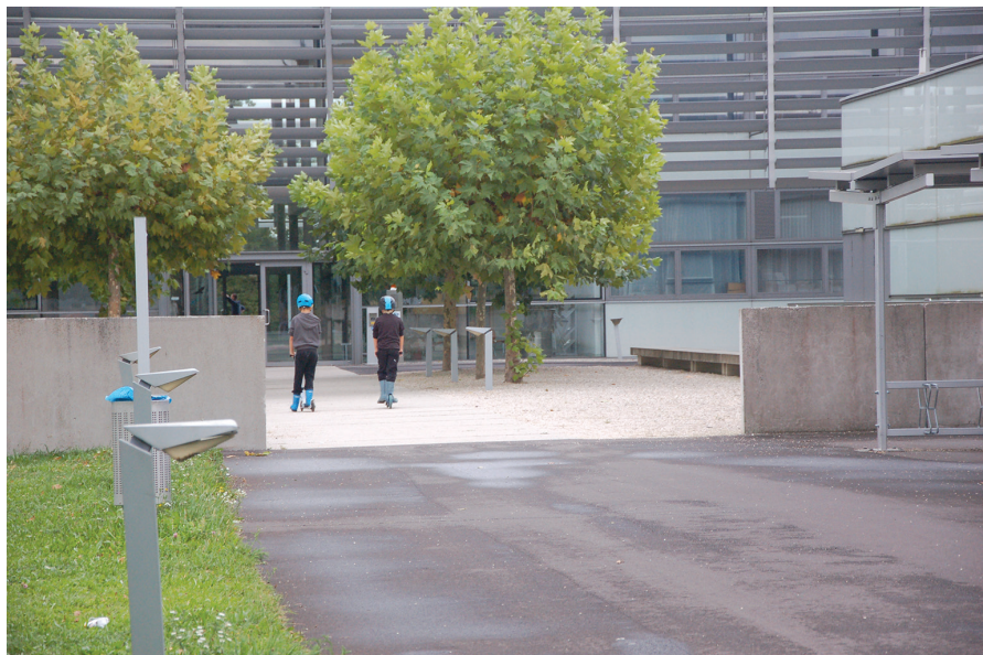
II. 9. Linz, SolarCity, Szkoła BRG SolarCity