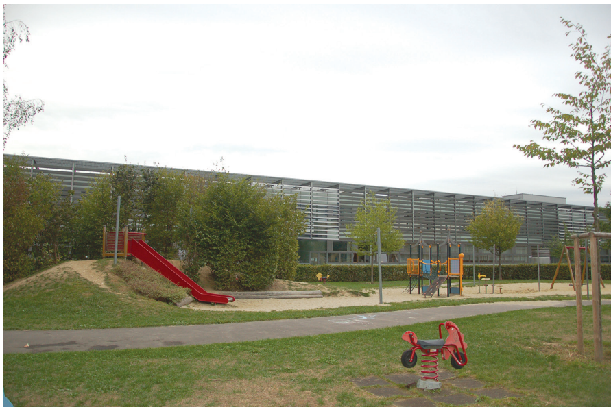
II. 10. Linz, SolarCity, Szkoła BRG SolarCity, tereny rekreacyjne