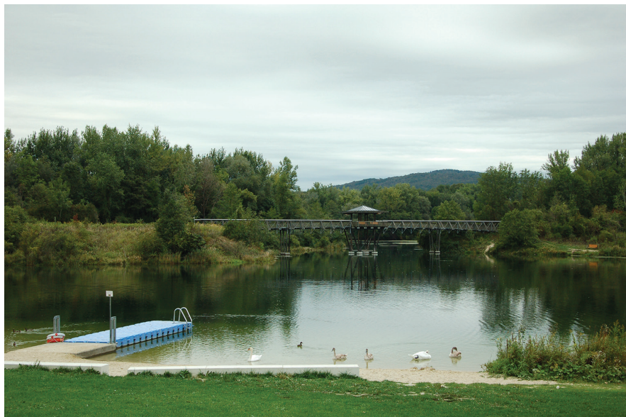
II. 7. Linz, SolarCity, Tereny rekreacyjne, okolice jeziora Weikersee (fot. M. Bednarz)