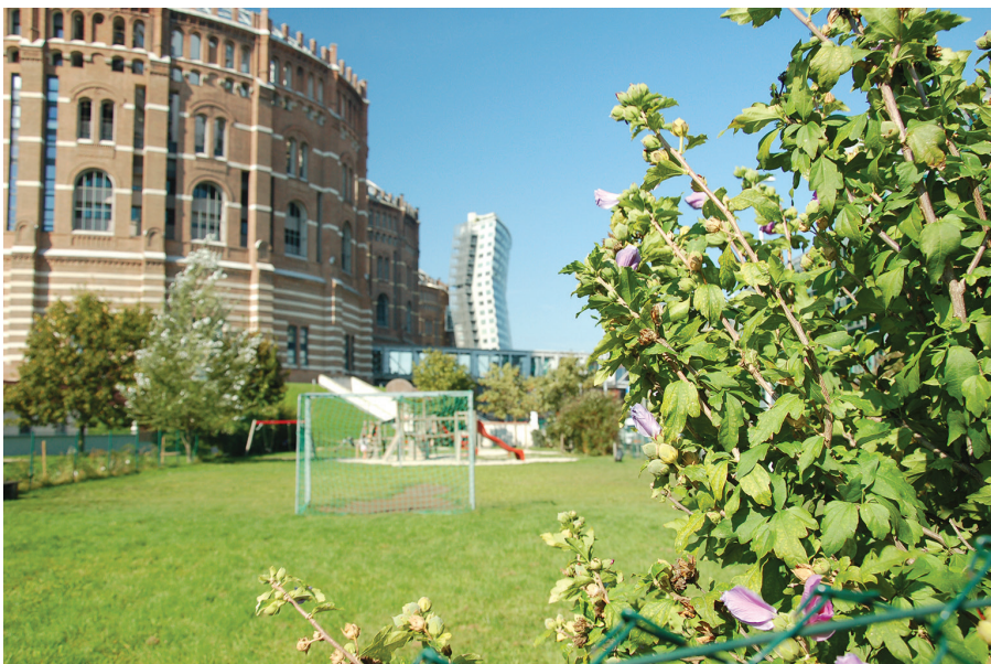
II. 2. Wiedeń, Gazometry, widok na plac zabaw