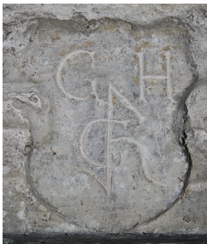
Il. 3. Gmerk budowniczego na renesansowym portalu domu przy ul. Letniej 34