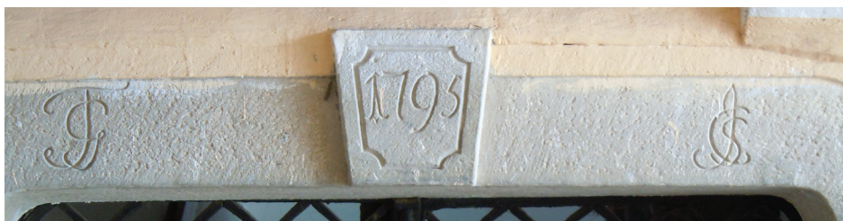
Il. 16. Inskrypcja na klasycystycznym portalu bramy domu przy ul. Letniej 51