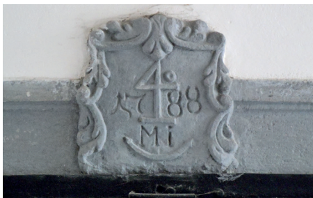
Il. 10. Kamienny mieszczkański gmerk nad wejściem do domu przy ul. Zimnej 77