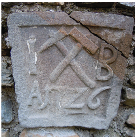
Il. 4. Gmerk mieszczkański na kamiennej tablicy domu przy ul. Zimnej 65