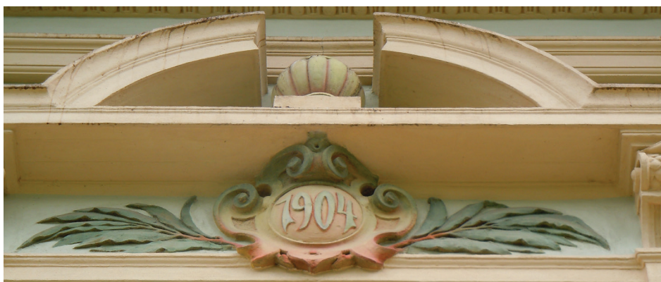
Il. 7. Kartusz z datą przebudowy na frontonie domu przy ul. Letniej 28