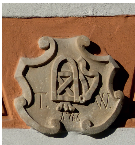
← Il. 9. Inskrypcja w polu owalnej dekoracji stiukowej w domu przy ul. Letniej 65