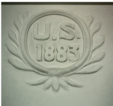
Il. 17. Inskrypcja w kartuszu w domu przy ul. Letniej 27