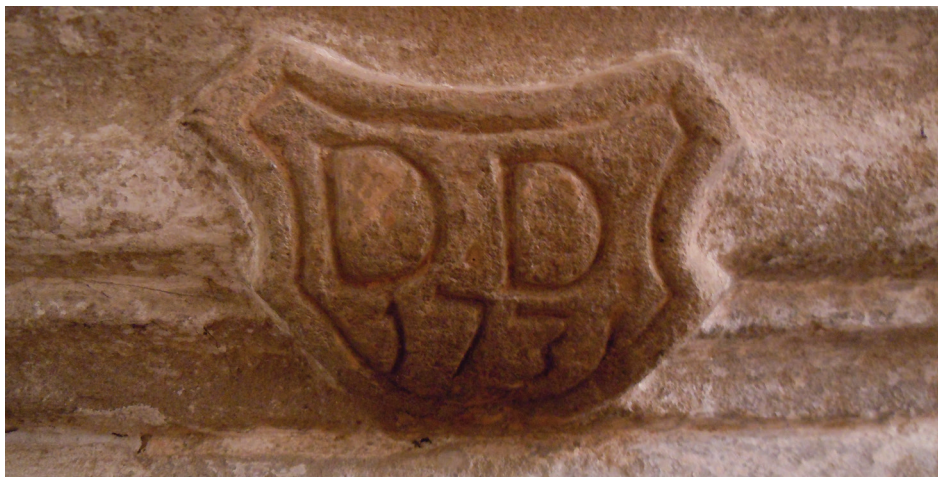
Il. 5. Kamienny mieszczański gmerk na portalu bramy domu przy ul. Letniej 40