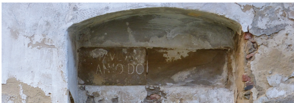
Il. 2. Inskrypcja na kamiennej tablicy domu przy ul. Letniej 34