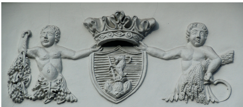
Il. 13. Herb rodu Jóny na stiukowej dekoracji frontonu domu przy ul. Letniej 45