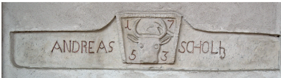
Il. 6. Kamienny mieszczański gmerk wtórnie umieszczony w murze domu przy ul. Letniej 28