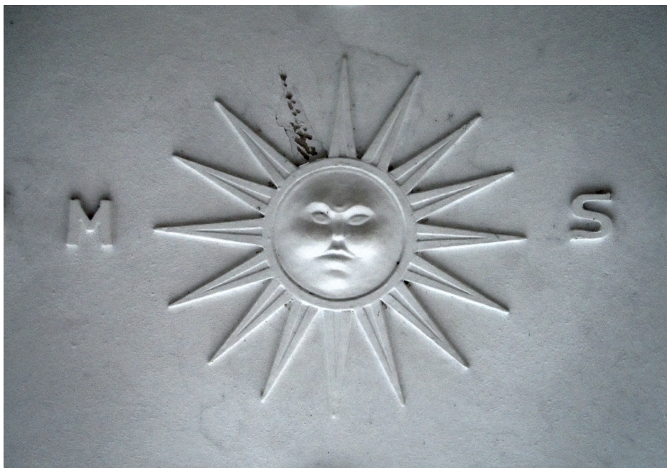
Il. 12. Godło herbu rodu Szontágh w stiukowej dekoracji sklepienia bramy domu przy ul. Letniej 45