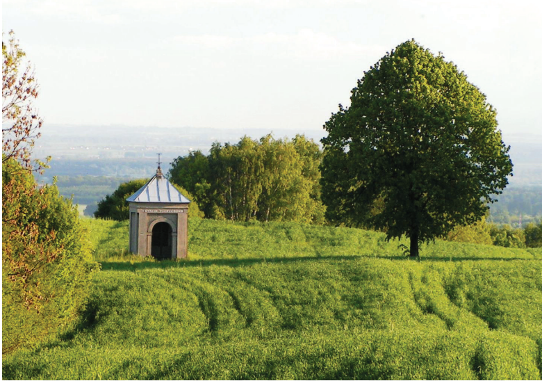
III. 3. Calvary on St. Anna hill