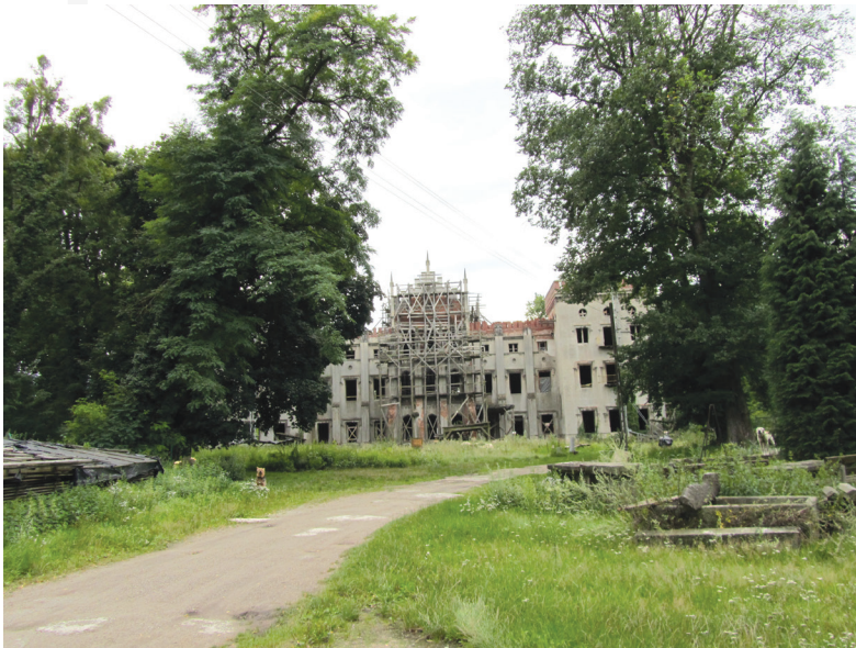
III. 4. A residence in Dobra, Opolskie voivodeship