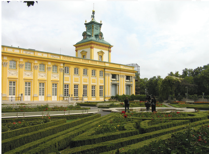
III. 2. Royal Gardens in Łazienki Królewskie, Bad Muskau, Wawel, Wilanów