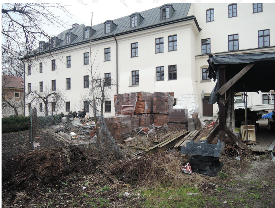
III. 1. Franciscans garden in Krakow