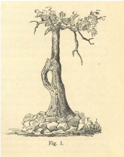
Ryc. 1. Zwieselbaum (rozszczepione drzewo).

schrift des Vereins für Volkskunde” z 1892 r. Ernst Friedel opisuje w nim okaz grabu pospolitego ( Carpinus betulus ), w którym: „prawa strona pnia rozwidła się około półtora metra nad ziemią, tworząc spiczastą szczelinę o długości około metra, która ponownie mocno rośnie u góry i jest tak gładka na wewnętrznych powierzchniach, że w przeciwieństwie do innych powierzchni pnia drzewa wygląda i czuje się, że ta gładkość jest przynajmniej częściowo sztuczna” 11 . Dalej etnograf amator opisuje zwyczaj przeciągania przez rozłupane sztucznie drzewo chorych dzieci i pozostawienia rośliny, aby zrosła się samoistnie (jeśli to nastąpiło choroba miała zostać wyleczona). O tym zwyczaju wspo-