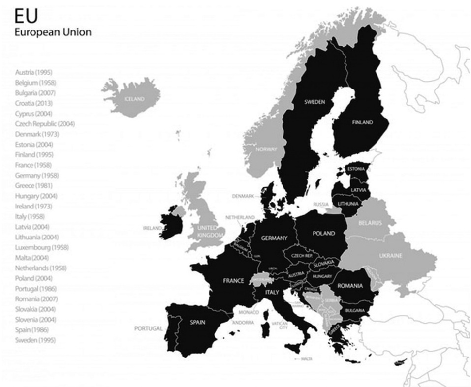
Mapa 1. Mapa polityczna Europy/Unii Europejskiej