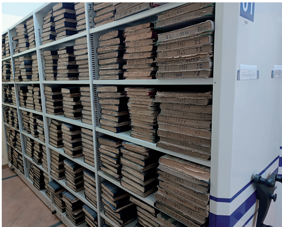
Ilustr. 3. Akta Państwowego Biura Notarialnego w Poznaniu w jednym z magazynów Archiwum Państwowego w Poznaniu