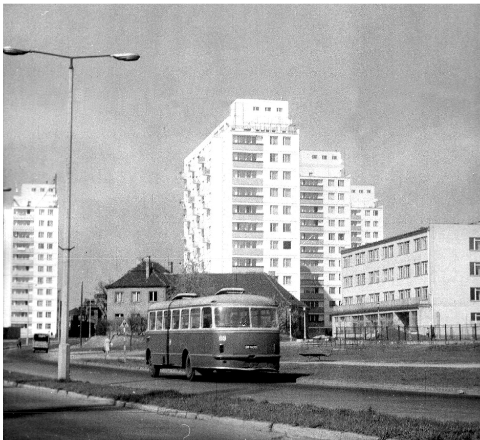
Fot. 6. Aleja Kopernika

W ostatnich latach coraz częściej przedmiotem zainteresowania archiwistów i historyków są kroniki. Dyskutuje się na temat wartości kronik szkolnych czy parafialnych jako źródła historycznego. Kroniki ze względu na zawartą treść opisującą zarówno minione, jak i bieżące wydarzenia oraz dołączoną do opisu dokumentację fotograficzną mogą stanowić wartościowe źródło historyczne 36 . Również dla genealogów przeglądających najchętniej akta metrykalne kroniki mogą być źródłem informacji 37 .