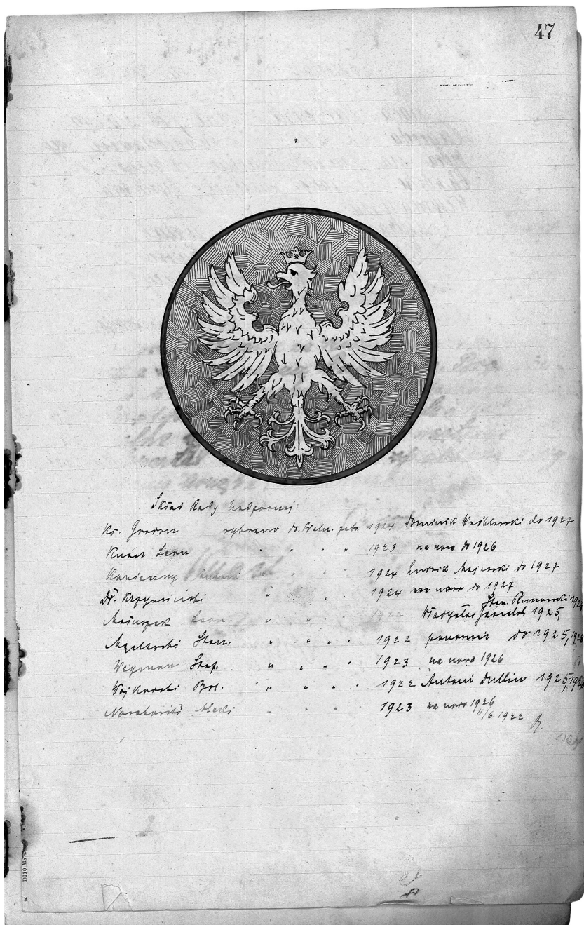
Fot. 1. Protokółarz Gartenstadt-Genossenschaft, który na początku zawiera wpisy w języku niemieckim. A od strony 47 już są protokoły rady nadzorczej spółdzielni „Zagroda”. Obydwie części protokółarza oddziela rysunek orła białego na czerwonym tle, źródło: Archiwum KSM, syg. akt. 27/1, s. 47