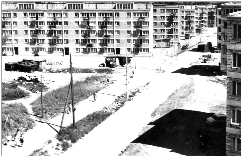
Fot. 4. Pierwsze bloki na osiedlu Piastowskim