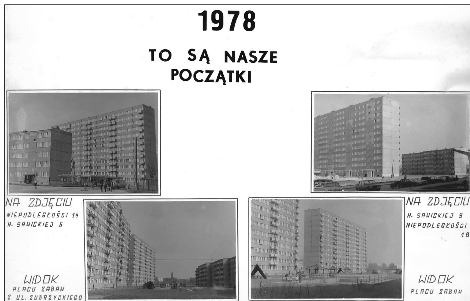
Fot. 7 Kronika Osiedla Młodych „Rąbin” – początki osiedla, str. 3, źródło: archiwum KSM, brak sygnatury