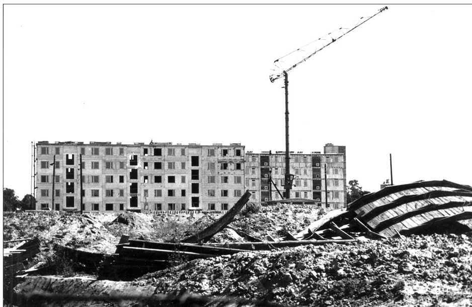
Fot. 5. Osiedle 700-lecia w Gniewkowie w budowie