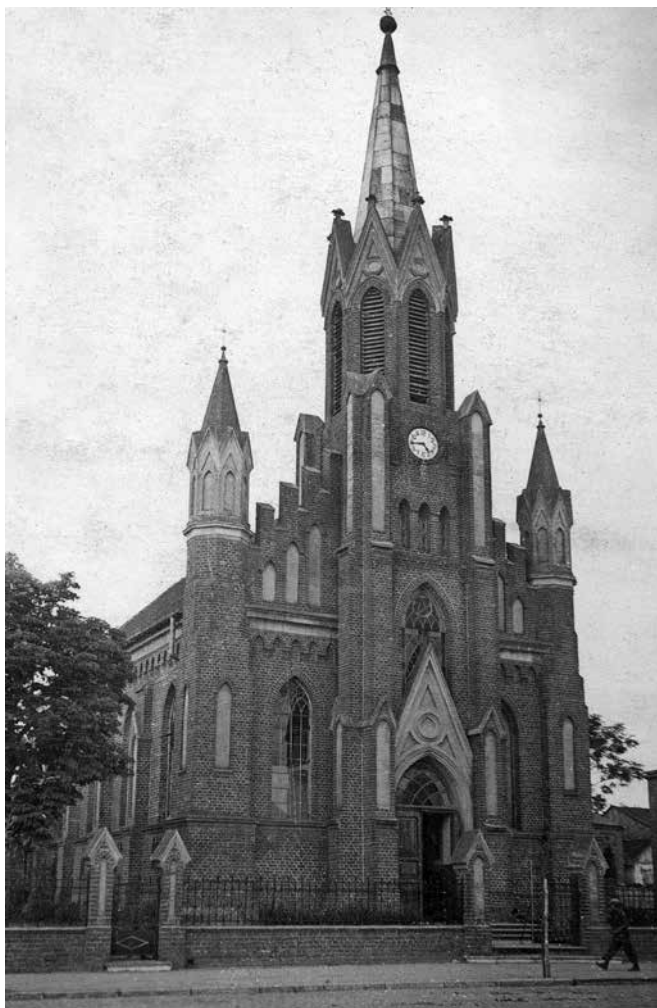
Fot.3 Kościół ewangelicki w Izbicy, koniec lat trzydziestych XX wieku

Po nabożeństwie głównym przeprowadzono kolektę na rzecz wsparcia kasy budowlanej, następnie członkowie kolegium kościelnego i komitetu budowlanego podejmowali Superintendenta Generalnego oraz pozostałych przyjezdnych pastorów.