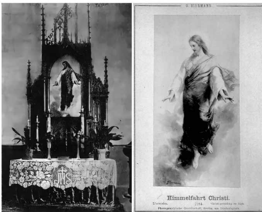
Fot.4. Ołtarz w kościele ewangelickim w Izbicy z obrazem „Wniebowstąpienie Chrystusa/ Himmelfahrt Christi” autorstwa Gottlieba Biermanna (po lewej), pocztówka z obrazem Gottlieba Biermanna (po prawej)