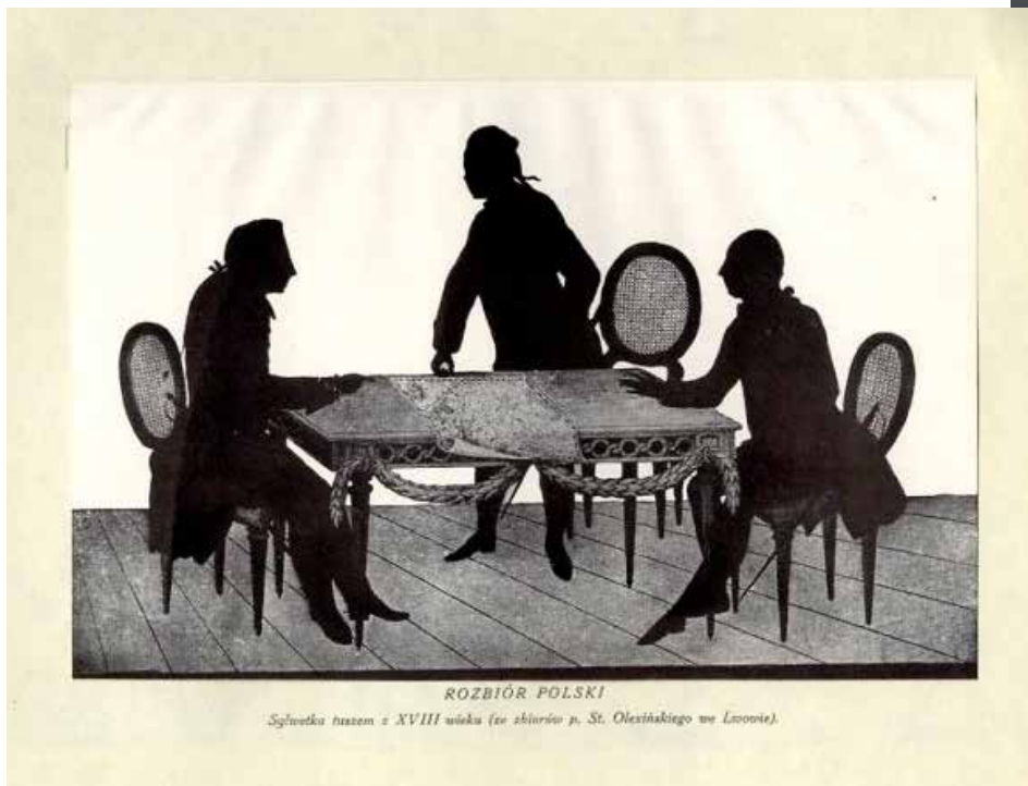
2. Rozbiór Polski, rys. anonimowy z końca XVIII w. (?). Według Sylwetki portretowe z czasów Stanisława Augusta. Album pięćdziesięciu dzieł i dziewięciu sylwetek, oprac. i wyd. M. Treter, Lwów 1923, tabl. 33

Dzieła z jego zbiorów były kilkakrotnie pokazywane publicznie. O ich charakterze tak naprawdę jednak niewiele wiemy, nie znamy też wielkości kolekcji. Wstępna kwerenda pokazuje, że musiał to być zbiór znaczący.