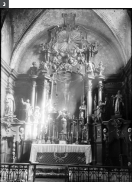
3. Ołtarz główny w kościele parafialnym w Mielcu, ok. 1928–1935.