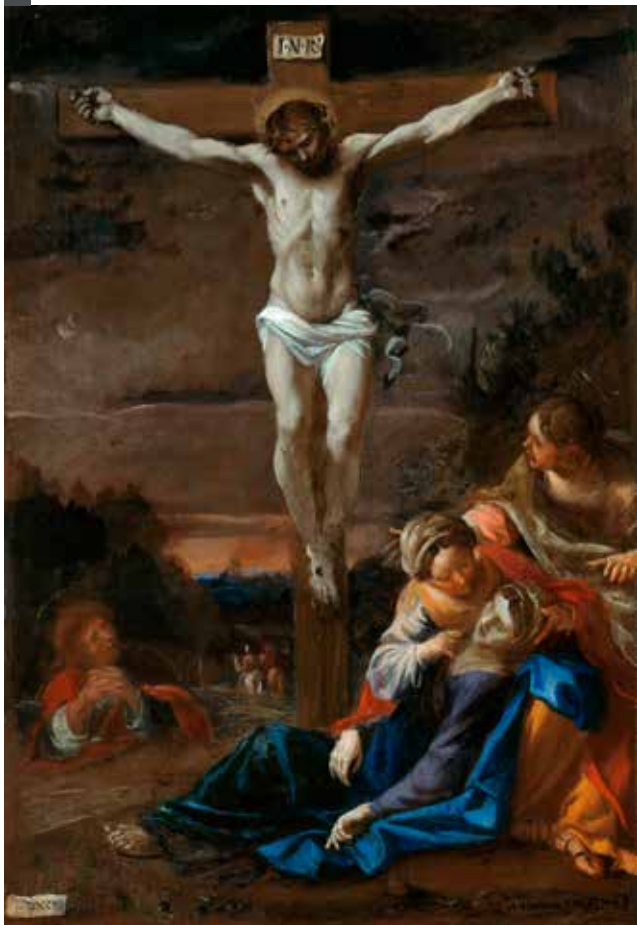
7. Ukrzyżowanie , Annibale Carracci, 1595, Berlin, Staatliche Museum