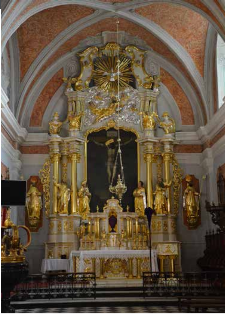
1. Ołtarz główny kościoła pw. św. Mateusza w Mielcu, stan po konserwacji, 2024.