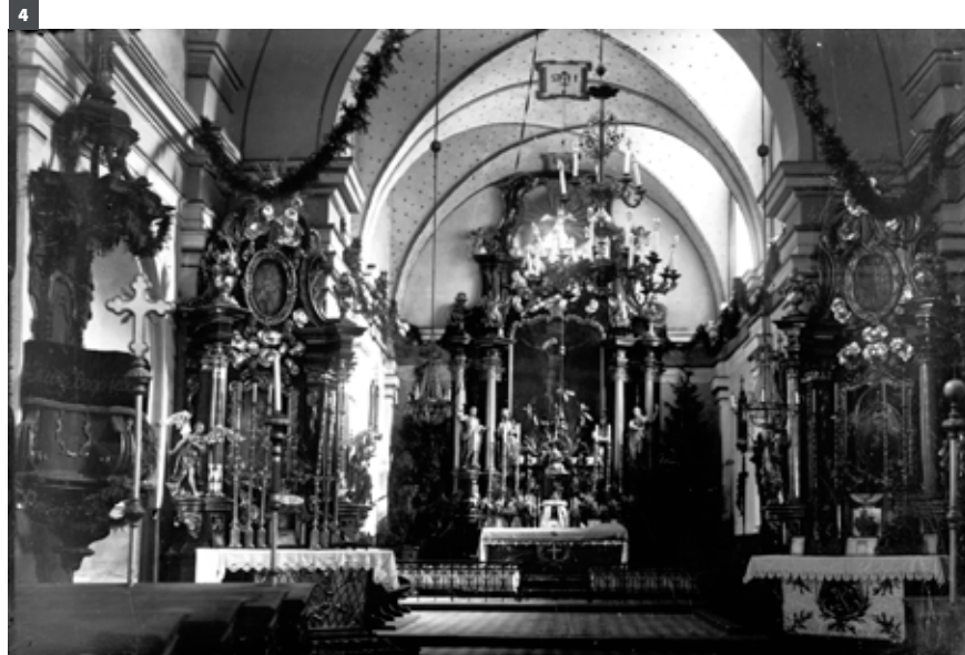
4. Wnętrze kościoła parafialnego pw. św. Mateusza w Mielcu z widokiem na ołtarz główny, 1935.

katalog kanoników kapituły 37 . W Przemyślu Przedbor stawił się 15 listopada 1679 roku, a na urząd kustosza kapituły instalowano go niecały miesiąc później – 29 grudnia 1679 roku. Prepozytem w Mielcu został 2 kwietnia 1683 roku i pełnił tę funkcję aż do rezygnacji przed 13 maja 1695 roku. Nie można natomiast wskazać dokładnego momentu, w którym objął parafię w Grodzisku. Na podstawie akt zachowanych w Archiwum Archidiecezjalnym w Przemyślu można określić jedynie przybliżony moment (około 1690 roku), w którym wśród pełnionych przez niego funkcji pojawia się określenie „curatus, parochialis Grodzisiensis” 38 .