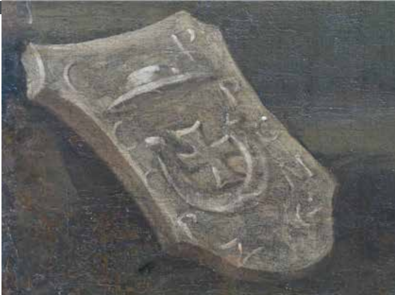
2. Ukrzyżowanie, kościół pw. św. Mateusza w Mielcu, stan po konserwacji, detal.

ku, należałoby uznać, że pojawił się on w Mielcu około 1610 roku. Przeczy temu jednak osoba fundatora, który w dotychczasowej literaturze pozostawał nierozpoznany, ze względu na błędne odczytanie zarówno sigli, jak i samego herbu.