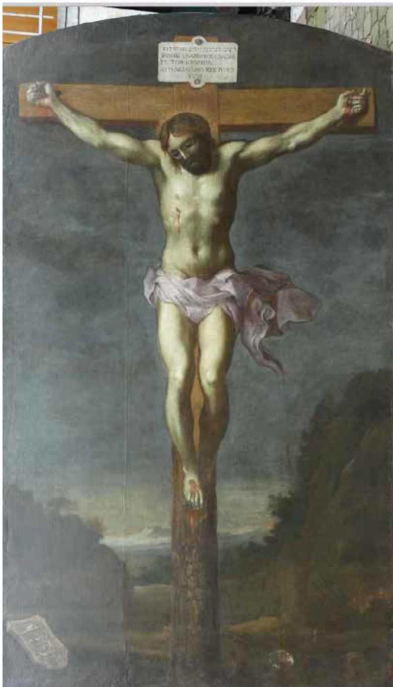
6. Ukrzyżowanie , kościół pw. św. Mateusza w Mielcu, stan po konserwacji w 2020 r.

Zestawiając ze sobą kompozycję Carracciego oraz rycinę Bloemaerta, można zauważyć, że grafika Holendra jest lustrzanym odbiciem pierwowzoru. Obraz z Mielca zachowuje natomiast układ znany z obrazu Carracciego, powtarzając wiernie wygląd skał po obu stronach krzyża, a przede wszystkim układ martwego ciała Chrystusa. Identyczne są detale, budowa mięśni, rozkład światła i cieni, a także układ fałd perizonium. Pozwala to sądzić, że w przypadku obrazu z Mielca malarz posłużył się lustrzanym odbiciem ryciny Bloemaerta, powracając tym samym do inventio Carracciego. Jednocześnie wprowadził pewne modyfikacje – korekty 49 , inaczej aranżując górzysty pejzaż na horyzoncie, zmieniając formę tytułusa z banderoli na prostokątną tabliczkę czy rezygnując z korony cierniowej nałożonej na głowę Chrystusa. Istotne są też wprowadzenie nieobrobionego pnia