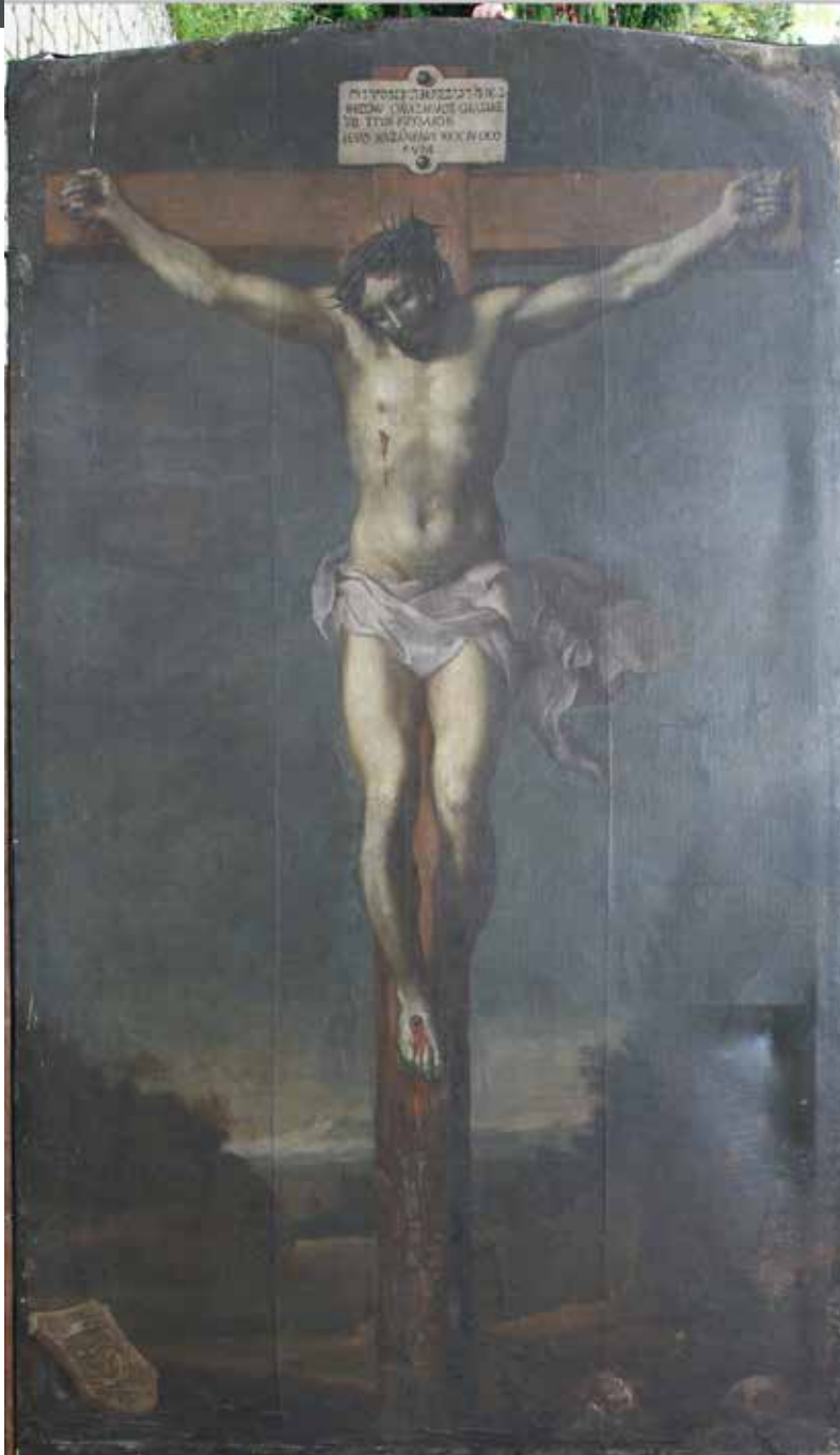
5. Ukrzyżowanie, kościół pw. św. Mateusza w Mielcu, stan przed konserwacją w 2020 r.

Miejsca oświetlone wydobyte są impastami, które w największych światłach pozwalają zaobserwować ślady pędzla. Artysta cienie zaznaczał cieńszą, natomiast partie jaśniejsze grubszą warstwą farby. Najbardziej oświetlone elementy, detale – załamania fałd perizonium, wystające kości palców czy kora nieobrobionej belki krzyża – są zaznaczone jasnymi impastami. Całkowicie impastowo, swobodnie, jest namalowany jasną farbą zarys czaszki w prawym dolnym rogu obrazu.