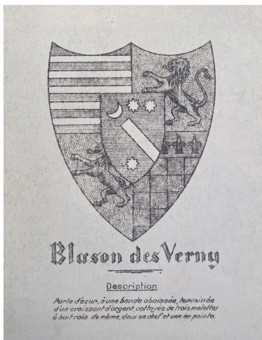
Ilustracja 4. Herb de Verny (Zamek Królewski w Warszawie – Muzeum, Gabinet Genealogiczno-Heraldyczny; II Archiwum Szymona Konarskiego: pudło 12, sygn. 252)