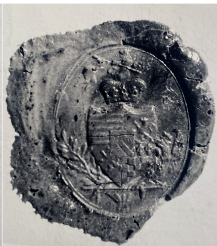
Ilustracja 5. Odcisk pieczęci herbowej de Verny w laku (Zamek Królewski w Warszawie – Muzeum, Gabinet Genealogiczno-Heraldyczny; II Archiwum Szymona Konarskiego: pudło 12, sygn. 252)