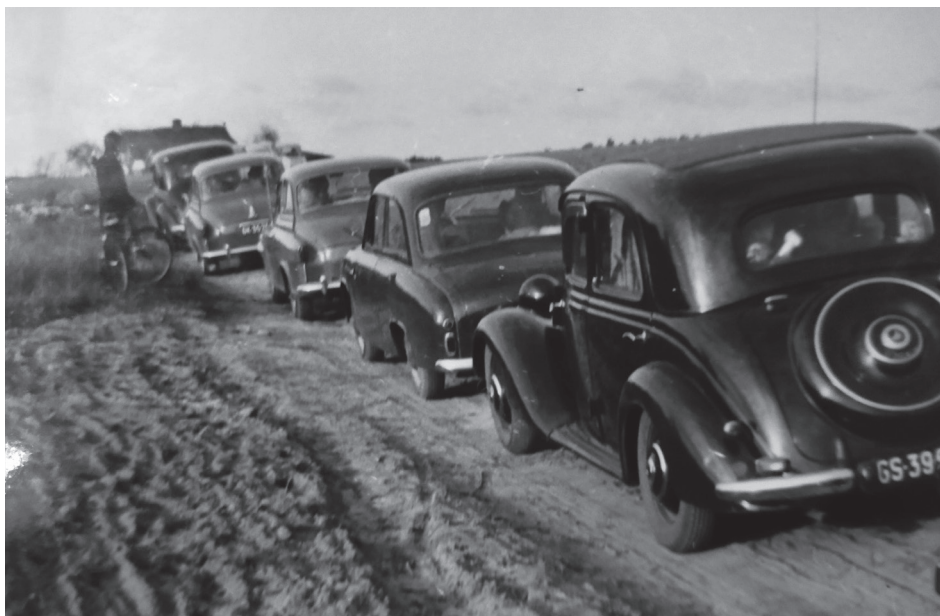
Ilustracja 2. Rajd turystyczny Automobilkлубu Morskiego, pierwsza połowa lat 60. XX w.

bardzo szybko powiększały się szeregi członków. Nie inaczej było w Automobilkлубie Morskim (il. 2). Działały w nim zarówno osoby, które posiadały swoje samochody i motocykle, jak i te, które dopiero planowały zakupić jakiś pojazd.