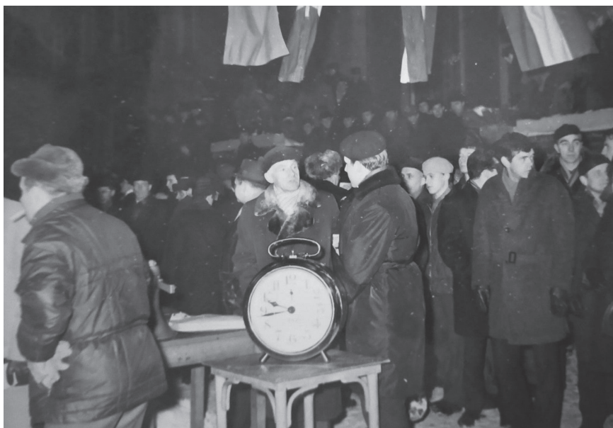
Ilustracja 4. Punkt kontroli czasu RMC 1966 na Targu Węglowym w Gdańsku

Mimo później pory trasa dojazdu do PKC oraz sam punkt były otoczone przez tłumy gdańszczan dopingujących każdy pojawiający się samochód. Jedyne, co zawiodło, to oświetlenie PKC i parku maszyn. Jak donosiły media, zawinił Wydział Gospodarki Komunalnej gdańskiego magistratu, który mimo wcześniejszych uzgodnień nie oświetlił odpowiednio Targu Węglowego 43 .