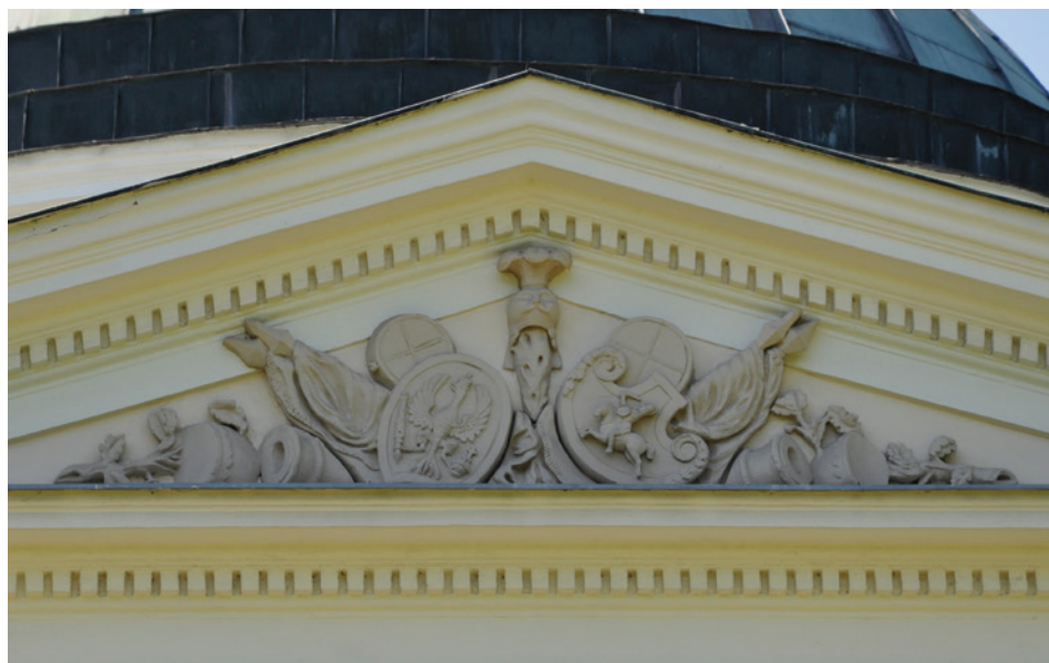
II. 9. Godła Polski i Litwy na elewacji pałacu