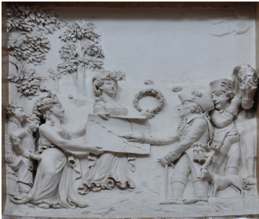
II. 7. Zatwierdzenie planów Kanału Bydgoskiego przez króla Fryderyka II