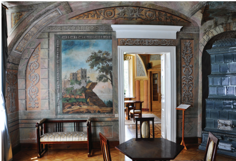
Il. 5. Wnętrze pałacu