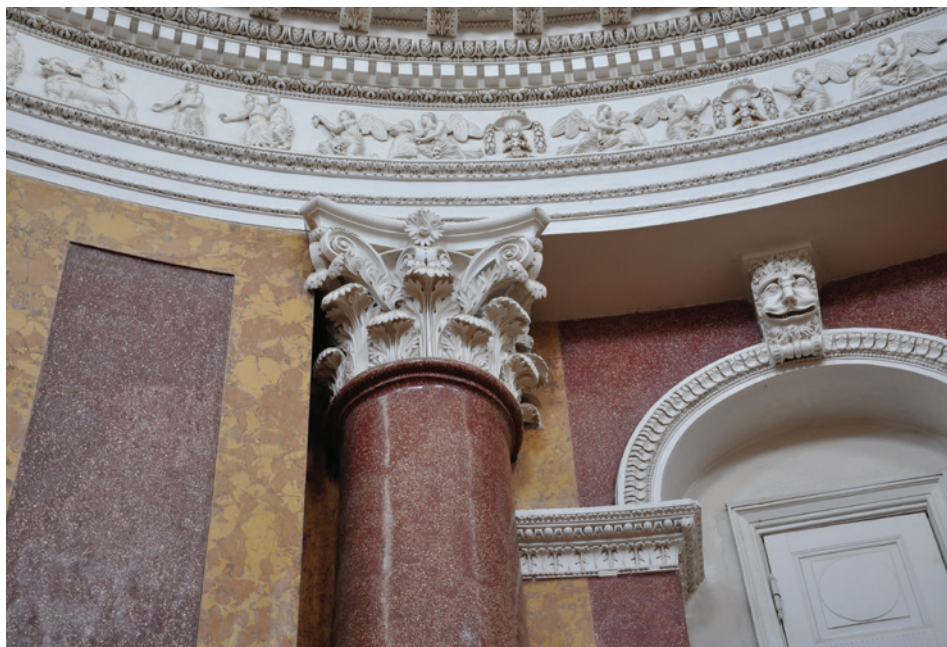
Il. 6. Fragment rotundy z kolumną w stylu korynckim