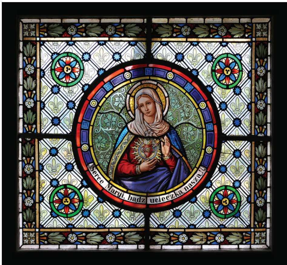
Il. 12. Maryja