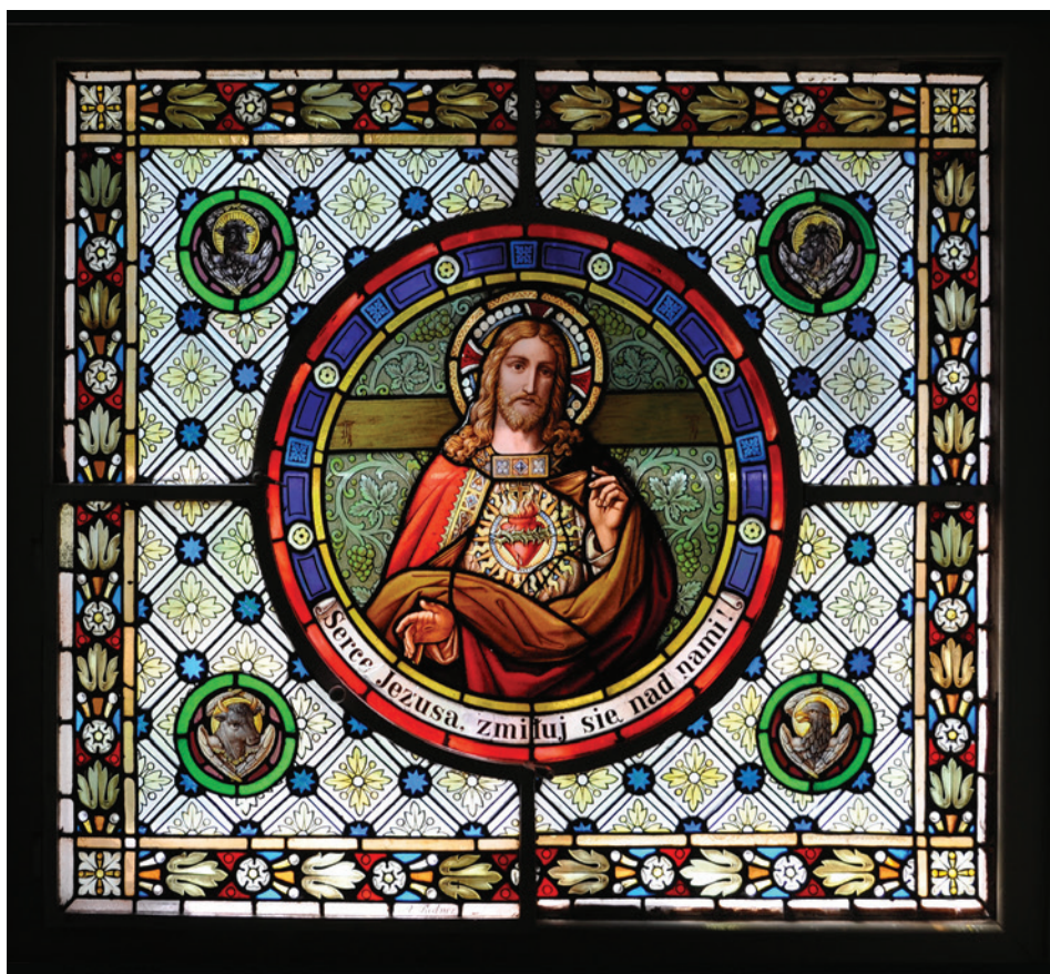
Il. 11. Chrystus

Po wojnie, jak wspomniano, pałac został przejęty przez państwo. Na terenie zespołu pałacowo-parkowego utworzono ośrodek wypoczynkowy. Dawna kaplica prywatna służyła jako kawiarnia. Usunięto z niej dwa witraże, które ocalały (il. 11 i 12). Następnie miało tutaj swoją siedzibę Państwowe Gospodarstwo Rolne. PGR za dbało o zachowanie pierwotnego założenia parkowego oraz samego pałacu.