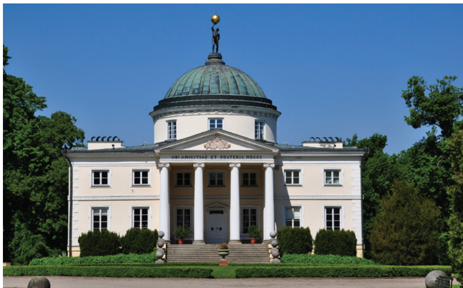
II. 1. Pałac w Lubostroniu