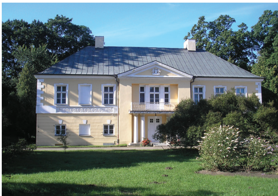
II. 2. Oficyna