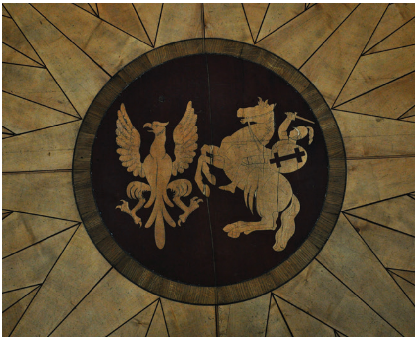
II. 8. Orzeł i Pogoń