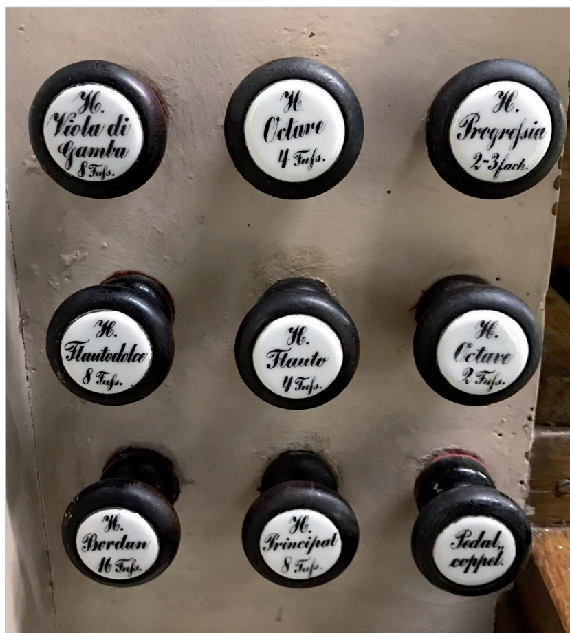
Ilustr. 3. Układ rejestrów oraz czcionka szyldzików rejestrowych

pą. Manubria umieszczone były po bokach stołu, choć znane są przykłady umiejscowienia ich nad manuałem (m.in. Liszkowo, Sośnica, Wielichowo). Rejestry były rozmieszczane symetrycznie, niejako w obrębie prostokąta w równych odległościach od siebie. Wyjątkiem od tych reguł są instrumenty przebudowywane, choć sygnowane nazwiskiem organmistrza. Porcelanowe szyldziki z nazwami rejestrów pisane były ozdobną czcionką, natomiast stopaź głosu oznaczany był słownie („Fuss”). W przypadku organów z dwoma manuałami tabliczka zawierała także oznaczenie sekcji: H. (Hauptwerk), O. (Oberwerk), P. (Pedal). W mniejszych instrumentach Gryszkiewicz łączył ciągło od dzwonka kalikanckiego ( Calcantenglocke ) oraz wypuszczenia powietrza z miecha ( Evacuant ). Niekiedy zastępował on włącznik połączenia manuału do pedału dzwigniową.