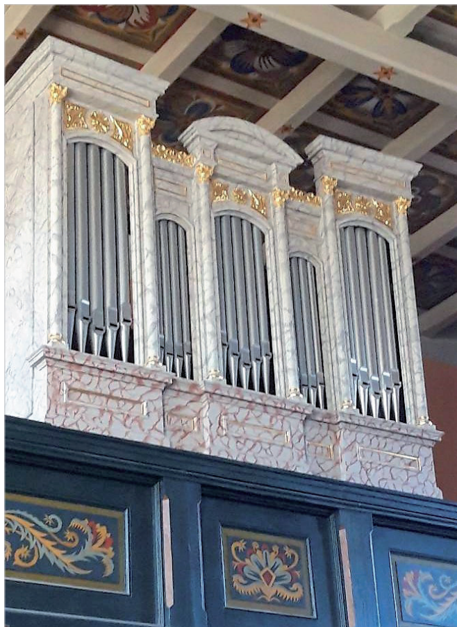
Ilustr. 1. Klasycyzujący prospekt autorstwa J. Gryszkiewicza w kościele w Szaradowie

Prospekty neogotyckie miały zazwyczaj trzy segmenty: skrajne zwieńczone były łukami siedmiolistnymi, środkowy zaś z dwoma polami piszczalkowymi, był zamknięty łukami trójlistnymi, nad którymi znalazł się ażurowy okrąg z wpisaną ośmioramienną gwiazdą. Segmenty zakończone były wimpergami z czwórliściami wpisanymi w okręgi. Rozdzielające słupy zakończone dookólnymi gzymsami przechodziły w wysmukłe sterczyny. Wimpergi zakończone były kwiatonami. Środkowy segment zwykle był nieco wyższy niż dwa pozostałe, choć w przypadku prospektu organów w Pęchowie jest on wyraźnie wyższy. Projekt organów dla kościoła w Wilkowyci pokazuje wariację na temat tegoż wariantu prospektu. Jest on trójdzielny i był bogato zdobiony dekoracją maswerkową, wraz ze sterczynami. Obecnie jego forma jest jednak bardzo uproszczona.