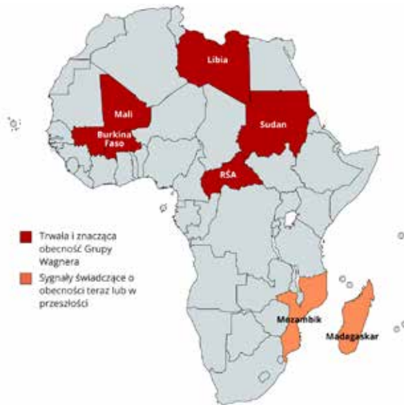
Rysunek 1. Państwa w Afryce, w których działa bądź działała Grupa Wagnera.

W wymiarze globalnym Grupa Wagnera mogła działać, w mniejszym lub większym zakresie, w ok. 30 państwach, m.in. w Europie Wschodniej (np. w Ukrainie), na Bliskim Wschodzie (np. w Syrii) i Ameryce Południowej (np. w Wenezueli), ale najbardziej widoczna jest jej obecność na kontynencie afrykańskim. To zaangażowanie, mające wpływ na sytuację wewnętrzną państw oraz na ich politykę zagraniczną, dotyczy przede wszystkim Mali, Burkina Faso, Libii, Republiki Środkowoafrykańskiej (RŚA) i Sudanu (rysunek 1). Wpływy wagnerowców na tym kontynencie sięgają jednak znacznie szerzej, o czym traktuje niniejsza analiza 7 .