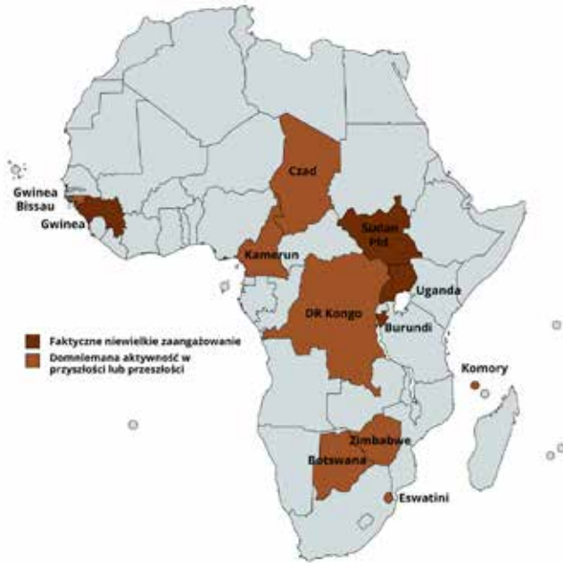
Rysunek 2. Państwa w Afryce, w przypadku których można mówić o faktycznym niewielkim zaangażowaniu bądź domniemanej obecności Grupy Wagnera.

Analizując obecność rosyjskich najemników w Afryce, warto dodać, że jednym z narzędzi dezinformacyjnych Kremla jest sztuczne kreowanie potęgi FR na tym kontynencie, jak również trzeba mieć na uwadze rosyjskie działania inspiracyjne.