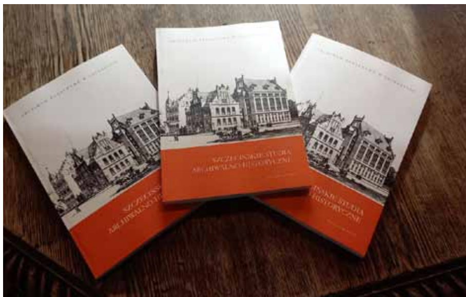
„Szczecińskie Studia Archiwalno-Historyczne” 2022, Tom VI, Szczecin 2022, ss. 203, il., ISSN 2544-3739

Opisywana publikacja to szósty tom rocznika Archiwum Państwowego w Szczecinie. Na jego zawartość składają się artykuły naukowe dotyczące archiwistyki i historii regionalnej. Poszczególne zagadnienia opisane przez autorów tego tomu znalazły się w następujących rozdziałach: Studia i materiały, Z praktyki archiwalnej, Ludzie archiwów, Z bibliotecznej półki, Publikacje Archiwum Państwowego w Szczecinie wydane w 2021 r., Kalendarium wydarzeń w Archiwum Państwowym w Szczecinie w 2021 r.