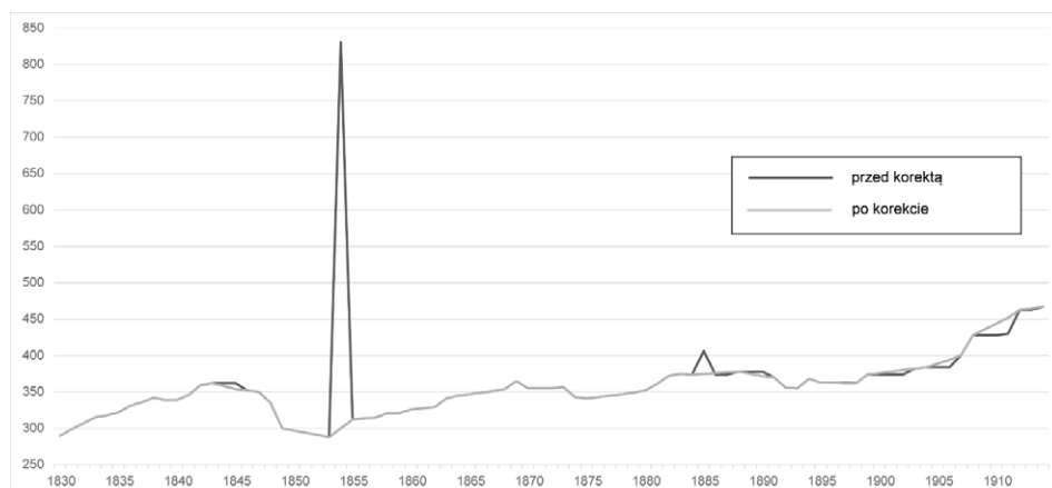
Ilustracja 2. Liczba wiernych grekokatolickich w Barwinku w latach 1830–1914