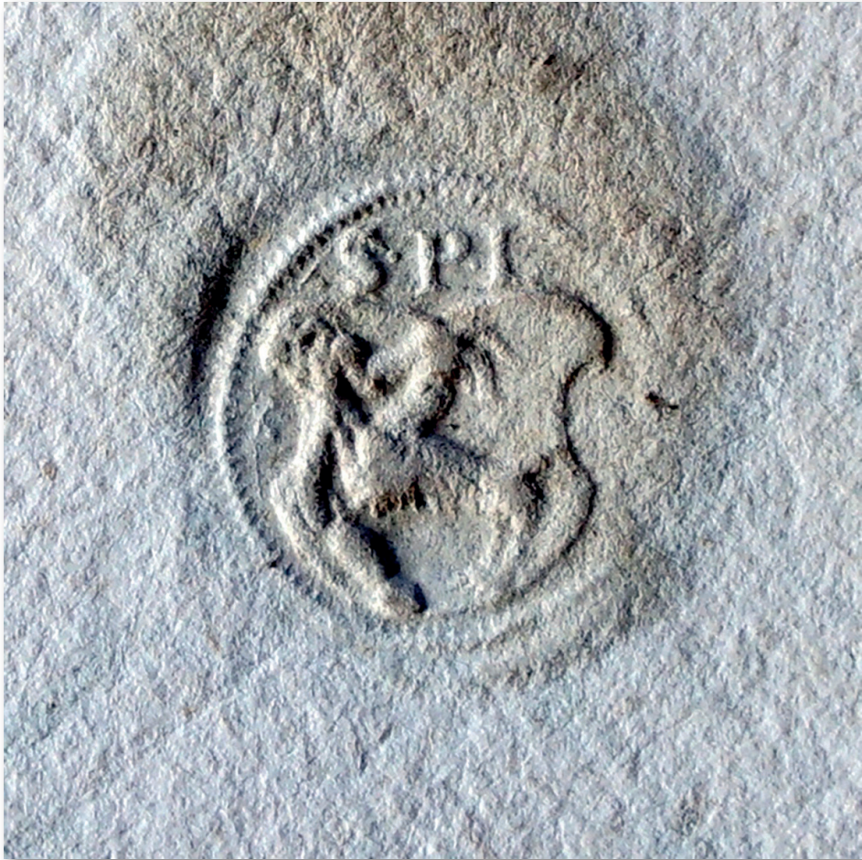
Il. 3. Odcisk pieczęci burmistrza na ekstrakcie z 4 lipca 1539 r.