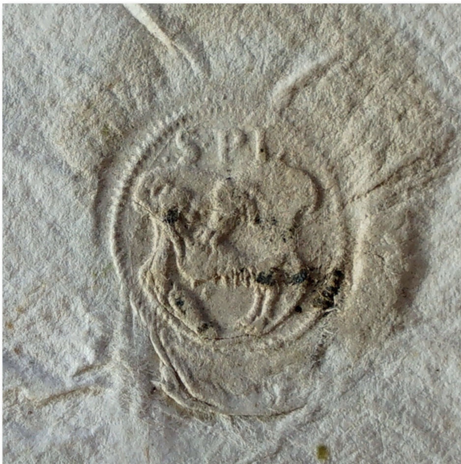
Il. 4. Odcisk pieczęci burmistrza na ekstrakcie z 19 grudnia 1539 r.