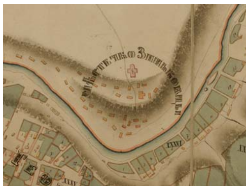
Ryc. 7. Fragment mapy z 1873 r. przedstawiający Zinkowce. Wyraźnie został zaznaczony kościół, natomiast nie ma na tym terenie budowli, którą można byłoby nazwać pałacem (Central'nij derżavnij istoričnij arhiv Ukraini, f. 492, op. 34, spr. 1172)