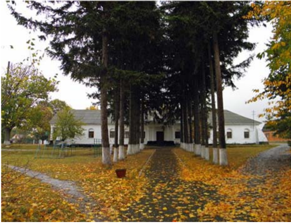
Ryc. 9. Dwór w Zinkowie