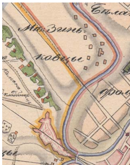
Ryc. 5. Fragment mapy wykonanej około 1830 r. przedstawiający Zinkowce. Dla porównania powierzchni – w dolnej części rysunku znajduje się Zamek kamieniecki. Mapa nie potwierdza istnienia pałacu w Zinkowcach