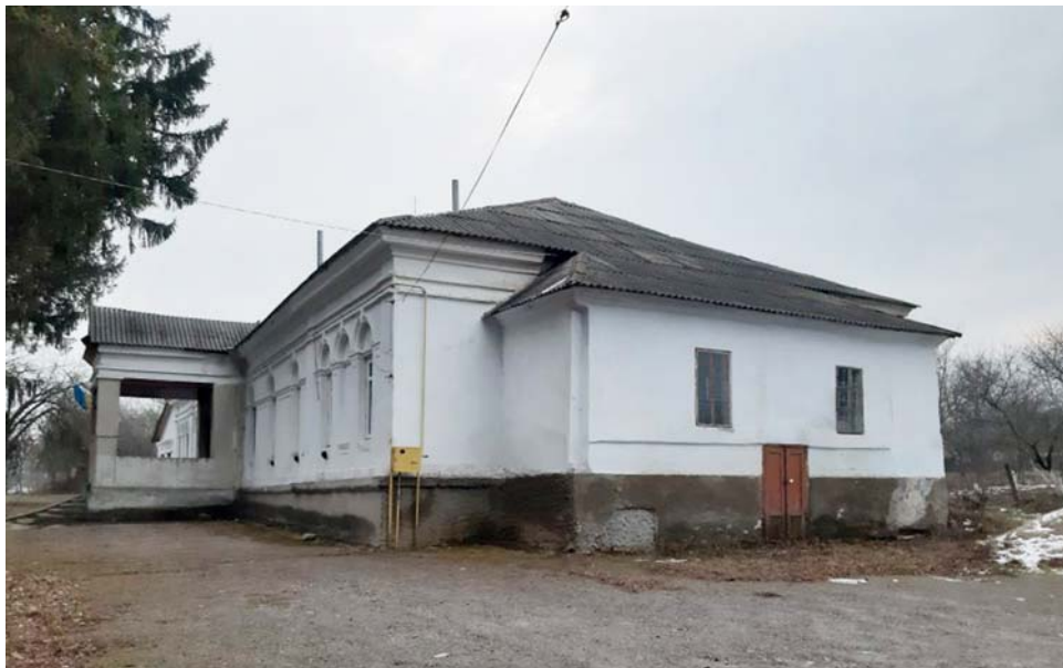
Ryc. 8. Dwór a obecnie biblioteka w Zinkowcach.