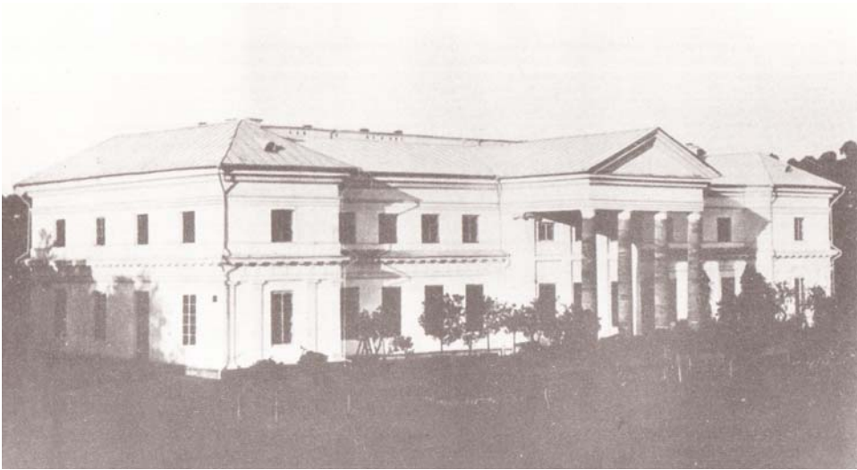
Rys. 1. Pałac Branickiej w Zinkowcach w około 1914 r. według Romana Aftanazego (źródło: R. Aftanazy, Materiały do dziejów rezydencji , t. 9 B, Warszawa 1992, fig. 419, s. 229)

budownictwa kresowego Roman Aftanazy podaje 3 , że w Zinkowcach znajdował się pałac klasycystyczny zbudowany prawdopodobnie na początku XIX w. przez Aleksandrę Branicką 4 . Otrzymała ona Zinkowce w darze od carycy Katarzyny II, która skonfiskowała majątek biskupstwa kamienieckiego za popieranie insurekcji kościuszkowskiej. Pałac miał stanąć na miejscu innego budynku, należącego do biskupów kamienieckich. Według Aftanazego 5 , Elżbieta 6 , córka Aleksandry Branickiej, w 1842 r. sprzedała swoje dobra Józefowi Bietkowskiemu 7 , który około 1850 r. przebudował pałac. Na początku XX w. miała to być budowla murowana, dwukondygnacyjna, trzynastoosiowa, założona na planie prostokąta (Ryc. 1). Dominantę fasady frontowej i tylnej tworzył zwieńczony frontonem, czterokolumnowy portyk. Okna były prostokątne, większe na parterze, a mniejsze na piętrze. Pomiedzy kondygnacjami znajdował się fryz tryglifowy. Środkową część budynku, od strony wejścia zajmował obszerny hall, zaś środek wielka hala balowa. Oprócz niej mieściło się w budynku 26 pokoi. W pobliżu została około 1890 r. zbudowana oficyna, a także wzniesiona w połowie XIX w. kaplica. Pałac miał przylegać do ogrodu o powierzchni kilku hektarów, który dochodził do brzegów rzeki Smotrycz. Majątek zinkowski, obejmujący 600 ha ziemi uprawnej i 200 ha lasów, pozostawał