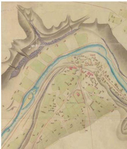
Ryc. 2. Zinkowce na planie Mieszczekowa z 1797 r. – B. Budynki murowane zaznaczono kolorem czerwonym, a drewniane brązowym