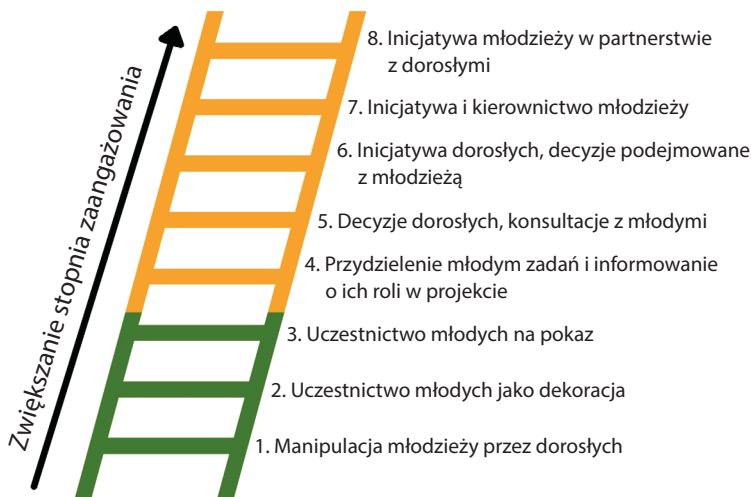
Rysunek 2. Drabina partycypacji dzieci i młodzieży

Źródło: opracowanie własne na podstawie R. Hart, Children's Participation: From Tokenism to Citizenship , „UNICEF Innocenti Essays” 1992, no. 4, s. 8.