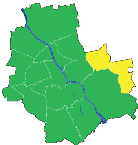
Rysunek 3. Młodzieżowe rady dzielnic m.st. Warszawy (stan na 1 maja 2023 r.)

Legenda: Kolor zielony – istnieje, kolor żółty – istniała w przeszłości, obecnie nie istnieje