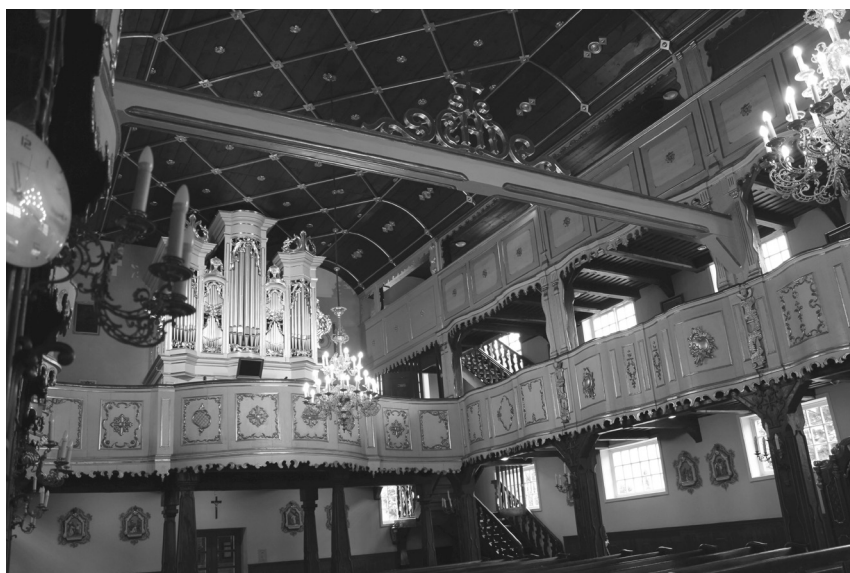
Il. 3. Kościół pw. NMP Królowej Polski, pierwotnie luterkański, Ostrow Wielkopolski, wewnątrz.

W nowych warunkach swoją świątynię mogła wybudować odradzająca się gmina w Jutrosinie, co nastąpiło w 1777 r., za pozwoleniem hrabiny Mielżyńskiej. Była to skromna budowla w konstrukcji szkieletowej, wzniesiona prawie wyłącznie ze środków wspólnoty. Nie dotrwała ona do naszych czasów – padła ofiarą pożaru w 1861 r. Na jej zgliszczach wzniesiono zachowaną do dziś budowlę ceglana 46 .