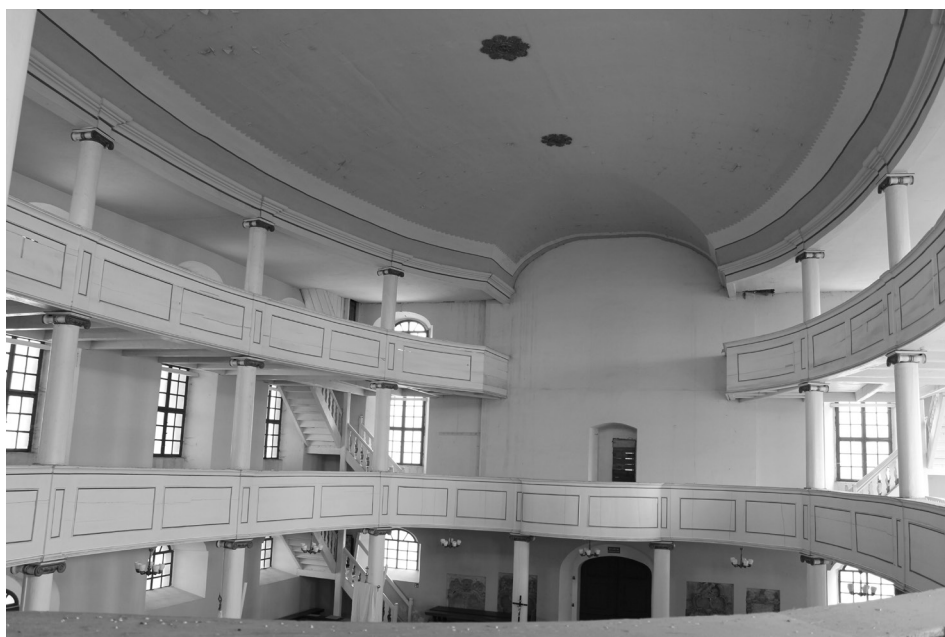
Il. 8. Kościół pw. Najświętszego Serca Pana Jezusa, pierwotnie luterński, Zduny, wewnątrz.