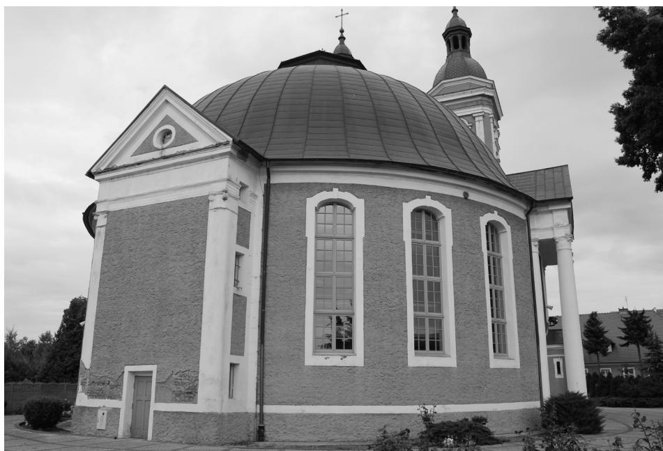
Il. 6. Kościół pw. św. Andrzeja Boboli, pierwotnie luterski, Krotoszyn, widok ogólny.

Świątynia centralna, murowana z cegły, powstała również w Krotoszynie. Tutejsza, powiększająca się wówczas gmina, obejmująca okoliczne wsie, starała się o własny obiekt do sprawowania kultu, by nie korzystać ze zdunskiego. Po uzyskaniu zgody przez synod generalny luteranów wielkopolskich we Wschowie i wsparciu finansowym dziedzica Wojciecha Husarzewskiego, własny kościół zbudowano w latach 1788-1790 52 . Wzniesiony na wzór ewangelicko-augsburskiej świątyni imienia Trójcy Świętej w Warszawie, znakomicie zaprojektowanej przez Szymona Bogumiła Zuga, a pośrednio nawiązujący do rzymskiego Panteonu, kościół krotoszyński otrzymał nowatorską formę klasycystycznej rotundy z czterema portykami kolumnowymi (zachodni obecnie zamurowany), nakrytej kopułą i pierwotnie zwieńczonej latarnią 53 . Obecna fasada z dwiema wieżami powstała w miejsce wschodniego portyku w czwartej ćwierci XIX w., kiedy kościół przebudowano 54 . Surowość budowlanej, zestawionej z prostych geometrycznych brył, pozbawionych podziałów architektonicznych, harmonizuje z jednolitym