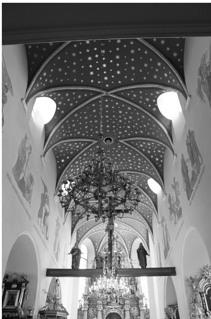
Il. 2. Kościół pw. Św. Jana Chrzciciela, pierwotnie braci czeskich, Krotoszyn, nawa główna.

XVIII w. 24 Z oryginalnej późnorennesansowej budowli zachowała się dzisiejsza zakrystia. Przekrywa ją sklepienie krzyżowe, zdobione nowożytnymi motywami rozet, uskrzydłych główek anielskich i plecionki. Obecnie obiekt użytkuje parafia rzymskokatolicka pw. św. Marcina.