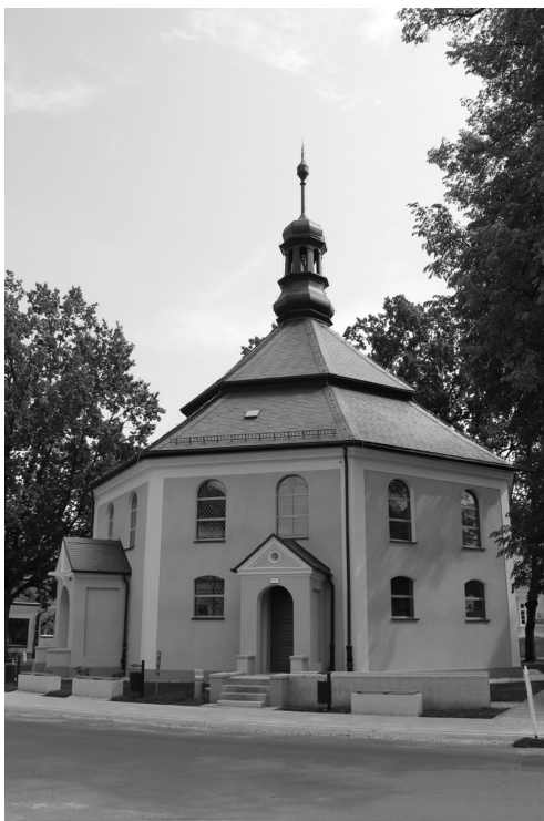
Il. 4. Kościół ewangelicki w Odolanowie, widok ogólny.