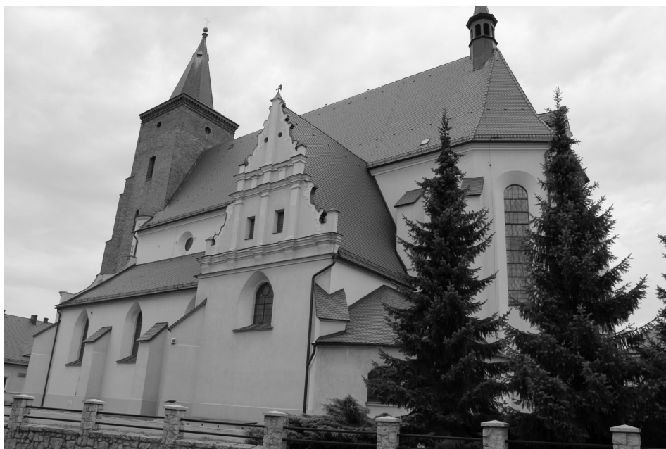
Il. 1. Kościół pw. Św. Jana Chrzciciela, pierwotnie braci czeskich, Krotoszyn, widok ogólny.

dycjach gotyckich używali takiego argumentu. Na terenie Wielkopolski kościoły o cechach gotyckich z elementami nowożytnymi budowano na przestrzeni XVI w. do pierwszych dziesięcioleci XVII stulecia 20 (kościół parafialny w Grabieni-cach, powiat koniński, ok. 1597 r.; kościół parafialny w Rozdrażewie, powiat pyzdrski, 1 ćw. XVII w. 21 ).