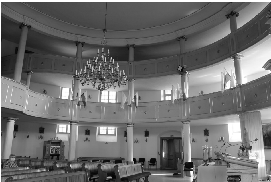
Il. 7. Kościół pw. św. Andrzeja Boboli, pierwotnie luterański, Krotoszyn, wnętrze.

w wyrazie, ascetycznym i jasnym wnętrzem 55 . Wypełniają je podwójne, drewniane empory wsparte na doryckich i jońskich kolumnach, obiegające kolisty korpus. Kolumny empor dźwigają także sufit z fasetą. Obecnie jest to kościół rzymskokatolicki pw. św. Andrzeja Boboli.